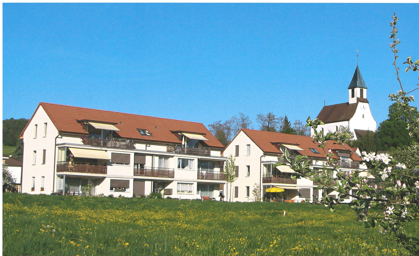
Alterswohnungen: Die ersten beiden Häuser der Genossenschaft «Wohnen im Alter». Auf der Wiese im Vordergrund sind bereits die nächsten zwei Häuser im Bau.

Diese gute Infrastruktur war es auch, die vor fünf Jahren den Gemeinderat bewogen hat, in Sachen Alterswohnungen etwas zu unternehmen. Als finanzausgleichsberechtigte Gemeinde fehlten die finanziellen Mittel, um als Bauherrschaft aufzutreten, so wurde die Genossenschaft «Wohnen im Alter Bözen und Umgebung» gegründet,