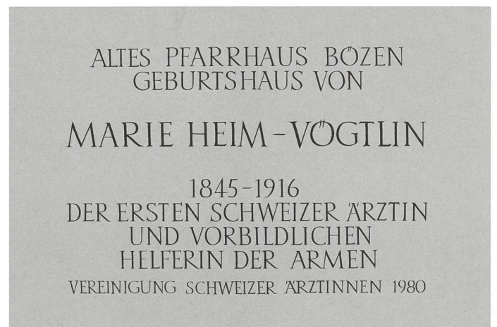
Die Gedenktafel für Marie Heim-Vögtlin, die erste Schweizer Ärztin, am Pfarrhaus Bözen

In jedem Fall ist und bleibt Bözen ein Dorf mit Zukunft.