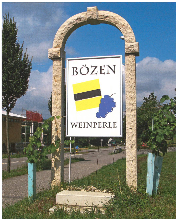
Am Dorfeingang. Analog den Rundbogen an den alten Fricktaler Bauernhäusern wurden diese Begrüssungstafeln an den Ortseingängen gestaltet.