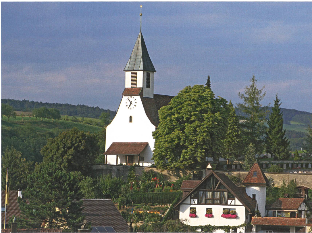
Die Kirche von Bözen – im Jahre 1667 erbaut – ist das markanteste Wahrzeichen des Dorfes.