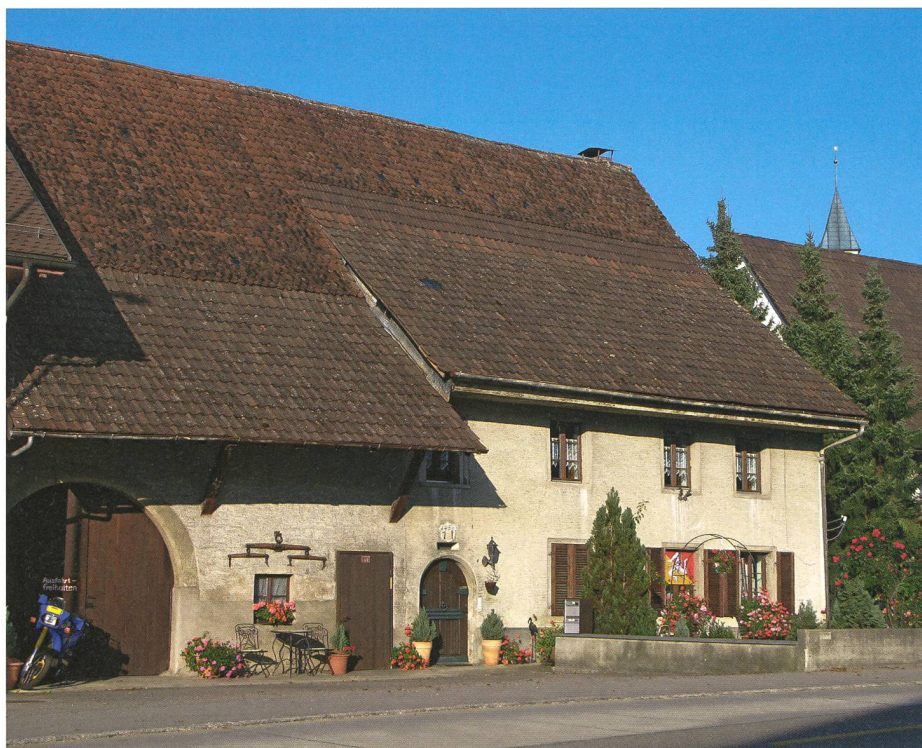
Das Zehntenhaus, neben dem Gasthaus «Bären» eines der ältesten Häuser von Bözen. Es dürfte im 16. Jahrhundert gebaut worden sein.

Mit den umliegenden Gemeinden besteht in vielen Bereichen wie Steueramt, Wasser, Abwasser, Spitex, Forstwirtschaft usw. eine gute Zusammenarbeit. Im Zivilschutz und in der Regionalpolizei reicht diese bis nach Frick. In den letzten Jahren wurde auch über eine Vertiefung dieser Zusammenarbeit bis hin zum Zusammenschluss oder zur Fusion diskutiert; entsprechende Abklärungen wurden gemacht. Da sich nicht alle Stimmbürger unserer fünf Oberfricktaler Gemeinden mit dieser