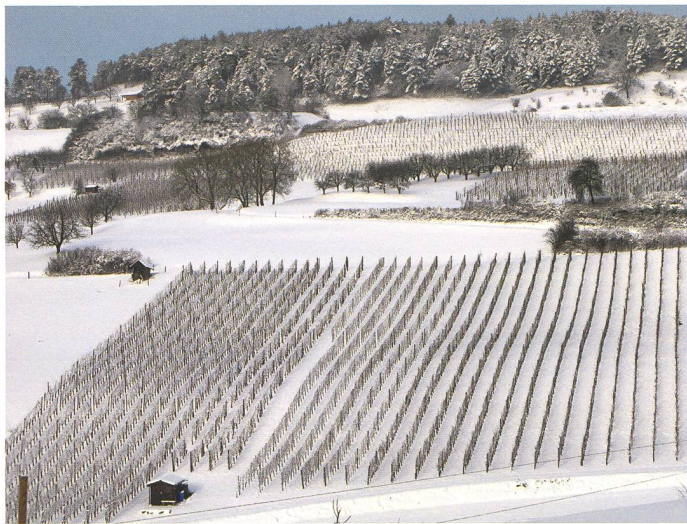
Rebberg im Winter. Von den drei Rebbaugelieten in der Gemeinde Bözen ist das Gebiet Stockacher - Unterziehl - Grueb das grösste.

berg» einmal im Monat die Geselligkeit. Ebenfalls monatlich treffen sich Seniorinnen und Senioren zum gemütlichen Beisammensein am Mittagstisch der Pro Senectute.