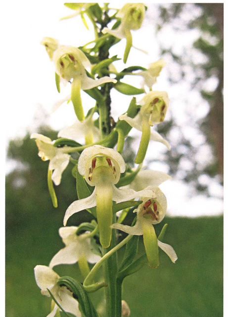
Das Naturschutzgebiet Nettenberg, ein Paradies für Naturfreunde. Magerwiesen in alten Föhren- und Wacholderbeständen sind der beste Standort für verschiedenste wunderschöne und seltene Orchideen.

Lösung anfreunden konnten, wurde sie nicht weiterverfolgt. Um inskünftig die Stellvertretung für Gemeindevorstand und Finanzverwalter zu gewährleisten, wird aber in den Räten über eine Zusammenlegung der Verwaltung diskutiert.