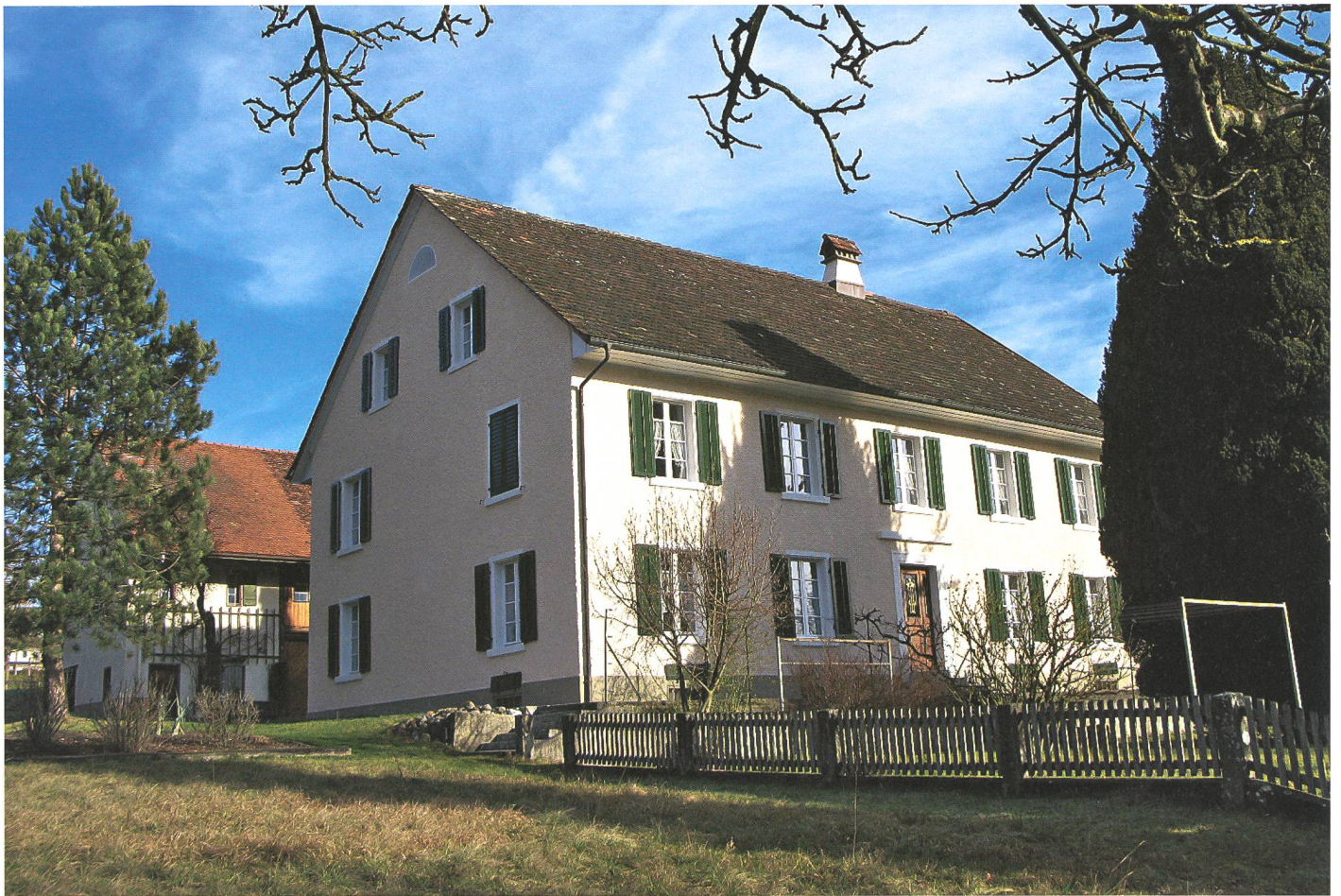
Das ehemalige Pfarrhaus. 1824/25 wurde anstelle des baufälligen alten Pfarrhauses auf dem Schloss in Elfingen ein neues, stattliches Haus samt Scheune im Bözer Ausserdorf gebaut.

Ortsbürgergemeinde nicht nur finanziell am Leben zu erhalten, wurde im Jahr 2005 die Aktion «Wer will Ortsbürger werden?» gestartet und an 22 Personen das Ortsbürgerrecht verliehen.