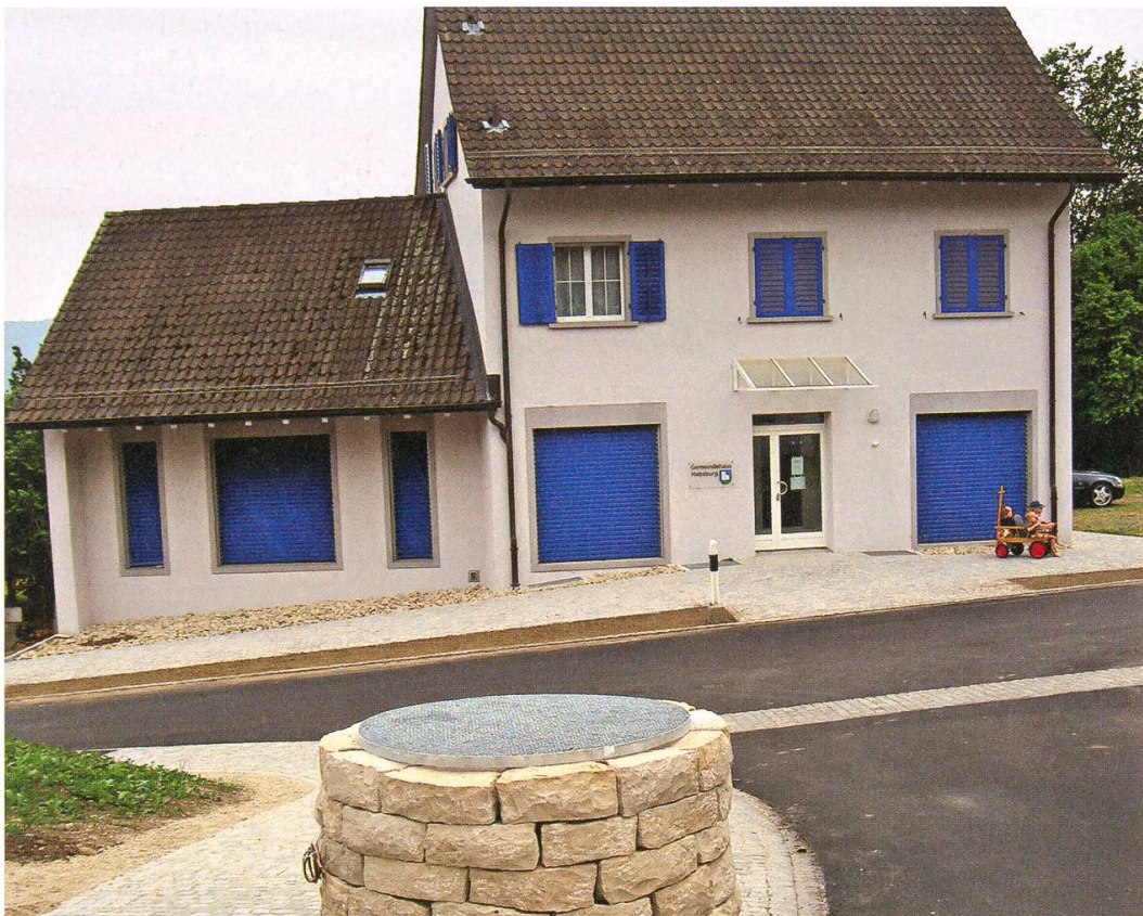
Das Habsburger Gemeindehaus (ehemals Dorfladen). Vorne der ausgegrabene Sodbrunnen.

Aber wir heutigen Bewohner von Habsburg gehen wahrscheinlich vergnügter zum Schloss hinauf als unsere Urahnen. Denn wenn früher der Burgvogt rief, gab es Fronarbeit zu verrichten. Wenn aber der jetzige Schlosswirt einlädt, winken Essen und Trinken in gepflegtem Ambiente. Der Kanton Aargau, dem die Burg seit 1803 gehört, widerstand Kaufangeboten. Er liess sich allerdings mit der längst fälligen Restaurierung Zeit. Gegen Ende des 19. Jahrhunderts machte er das Schloss zu einer Gaststätte – unserer einzigen Dorfwirtschaft – und zum beliebten Ausflugsort. Besucher sind nicht selten Schulreiseklassen, Senioren auf dem Altersausflug, Hochzeitsgesellschaften.