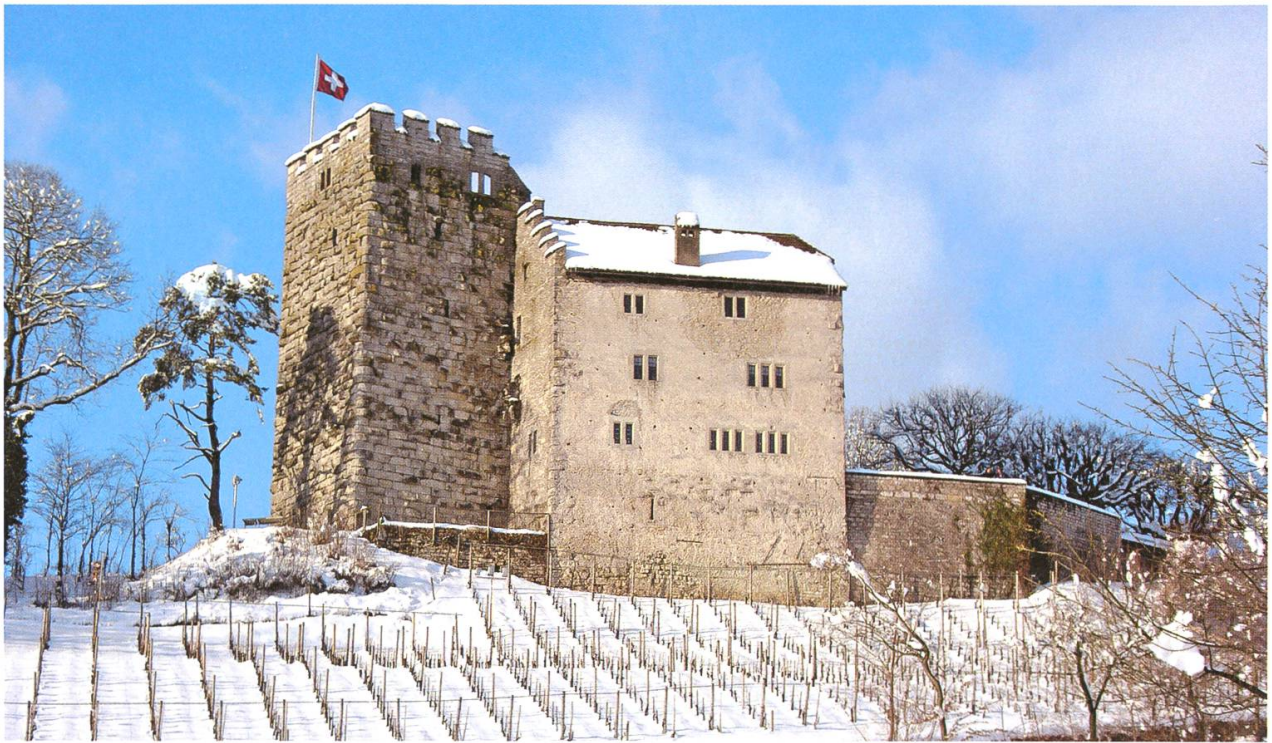
Schloss Habsburg im Winter.