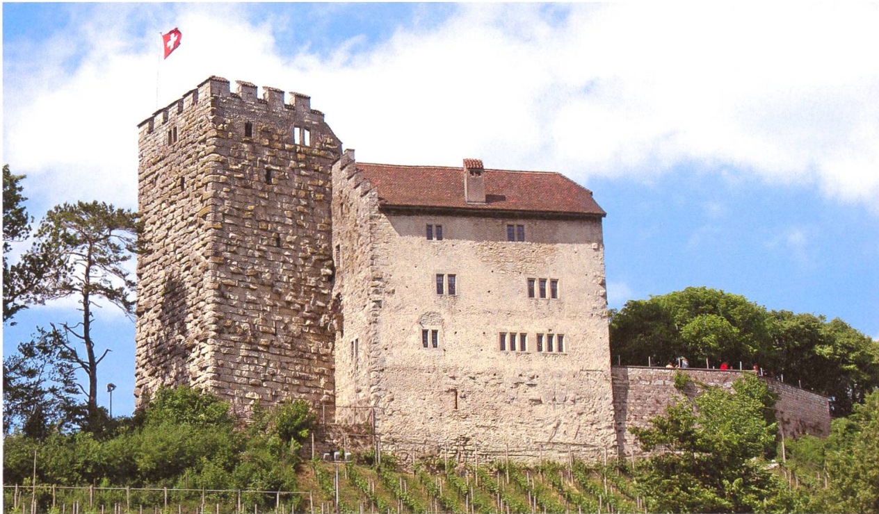
Schloss Habsburg von Süden im Sommer.