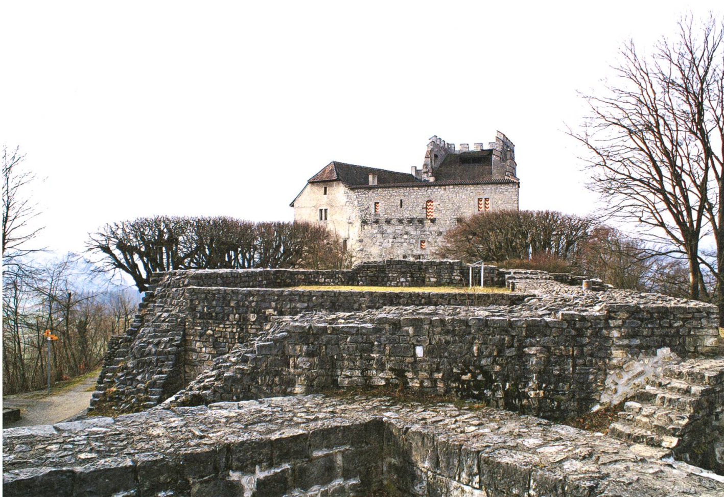
Blick auf die Burganlage von Osten. Im Vordergrund die rekonstruierten Grundmauern der abgebrochenen Vordern Burg. Im Hintergrund die noch stehende Hintere Burg.

wertet das Dorfbild auf. Sie wird durch solide Wehrsteine, die vor der Erfindung der Leitplanken die Passstrassen säumten, durch Pflasterungen bei Einmündungen der Nebenstrassen, Rosenrabatten dem Gehweg entlang und gediegene Strassenlampen akzentuiert. Das mittlerweile andernorts kopierte Pionierprojekt machte auch wegen der rekordverdächtig raschen Ausführung Schlagzeilen: Es dauerte keine drei Jahre vom ersten Gespräch des Gemeinderates mit dem kantonalen Baudirektor bis zur Einweihung des Werkes.