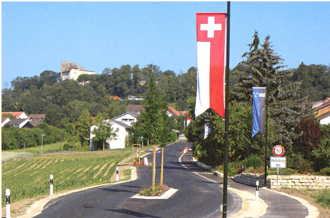
Eingang zum Dorf Habsburg von Osten.