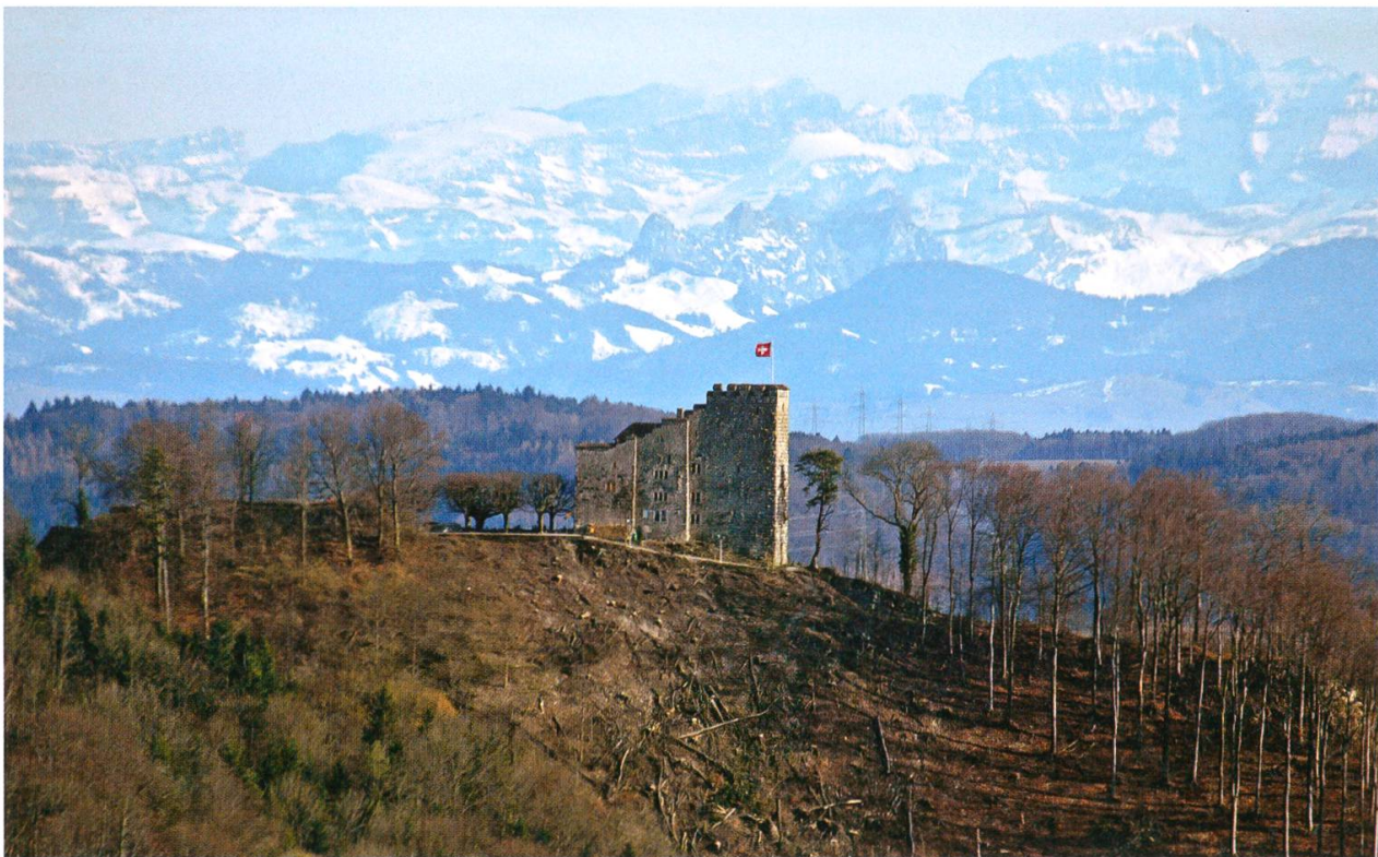
Die Habsburg von Norden. Blick vom Bözberg am 26. März 2006. Die Rodungen haben die Burg wieder sichtbar gemacht.

Was für eine Zukunft hat die Kleingemeinde Habsburg? Sie präsentiert sich als ländlicher, ruhiger Wohnort im Industriedreieck Baden–Brugg–Birrfeld, in der Nachbarschaft des Nordwestschweizer Fachhochschulzentrums Brugg-Windisch, dem inskünftig grössten Bildungsstandort zwischen Zürich, Basel und Bern, sowie an günstiger Verkehrslage in der Autobahnmitte zwischen Zürich und Basel. Aber wer in Habsburg wohnt, ist auf ein Privatfahrzeug oder die öffentliche Verbindung mit dem Postauto angewiesen. Einkaufen muss man auswärts. Das Dorf verfügt auch über keine eigene Poststelle mehr. Wir hoffen hingegen, der latenten Schliessungsgefahr der Dorfschule, die von der ersten bis fünften Klasse keine dreissig Schüler mehr zählt, aber ein starkes, verbindendes Element in der Bevölkerung darstellt, bis auf Weiteres entrinnen zu können.