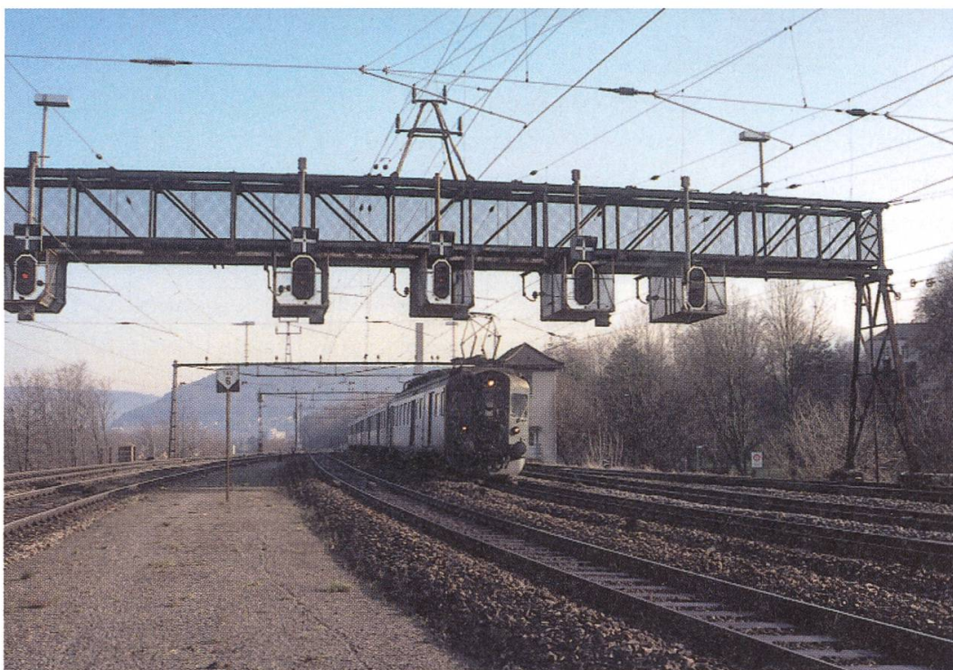
Die Signalbrücke Seite Ausfahrt Turgi (abgebrochen 2005). Bei den SBB sind von diesen nur noch wenige vorhanden. Im Hintergrund das Stellwerk 1.

les ausgebaut und umstrukturiert ist, selber unter Druck, jedenfalls für Personal und Verwaltung. Brugg ist nur noch eine regionale Dienststelle ohne Bahnhofinspektor; es ist sogar geplant, Brugg fernzusteuern. Ab dem Fahrplanwechsel vom 12. Dezember 2004 musste für einen Teil des Personals eine neue Lösung gefunden werden. Aus technischen Gründen bleiben die Arbeitsplätze in der Fernsteuerung für die nächsten Jahre noch erhalten; dies ist ein Glücksfall für rund 14 Personen. Dann aber ist geplant, Brugg am RCC (Rail Control Center) in Olten anzuschliessen; doch das dürfte noch einige Zeit dauern. Administrativ ist die Verwaltung des gesamten Personals heute je nach Dienststelle unter Olten, Basel, Luzern und Zürich aufgeteilt, was sich ab und zu nicht unbedingt positiv auf die Entscheidungswege auswirkt.