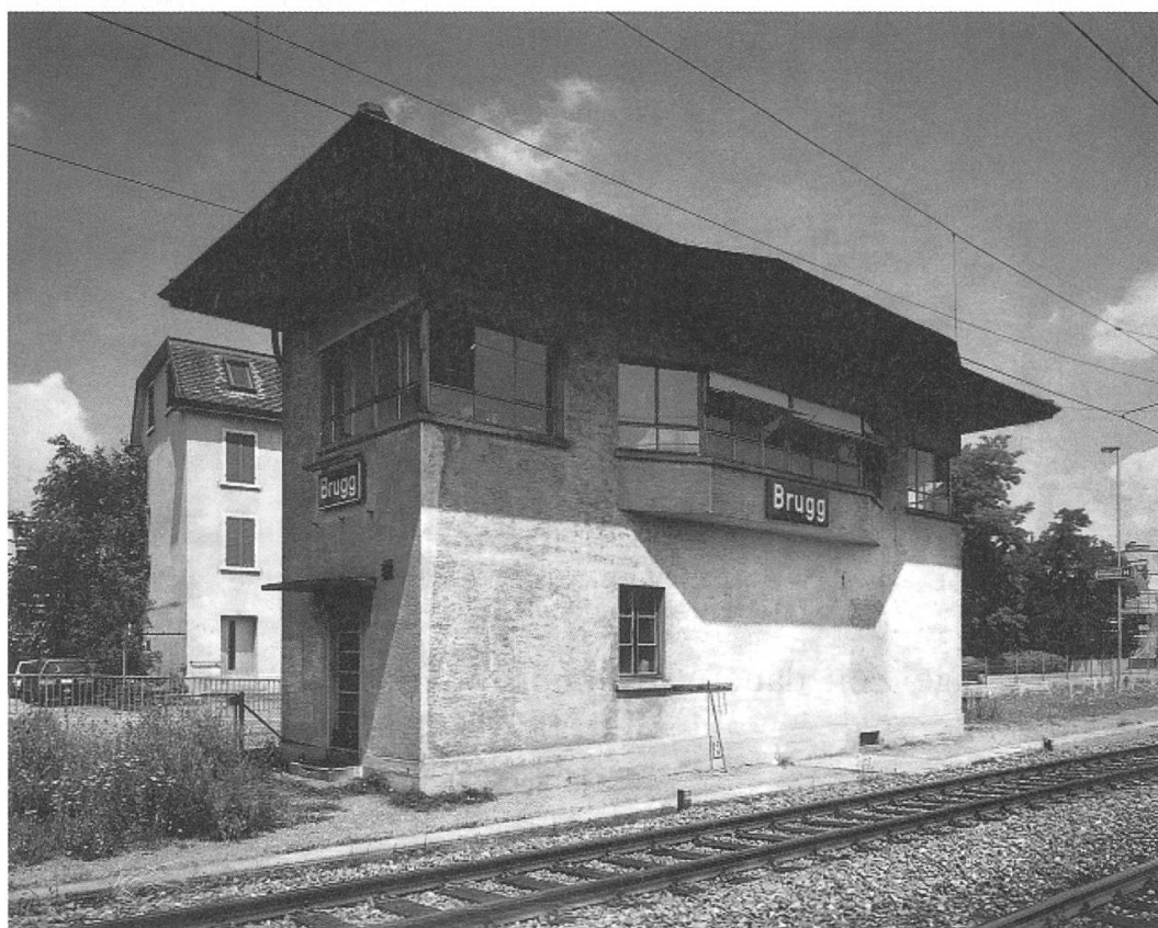
Das Stellwerk 2 an der Aarauerstrasse, ein typischer Bau mit auskragendem Arbeitsraum (abgebrochen 2005).

Mit der Beseitigung der letzten Einspurinsel auf der Nord-Südachse zwischen Brugg und Othmarsingen wurde der «Laubsägelbahnhof» Birrfeld eliminiert; es entstand der neue Bahnhof Lupfig. Die Eröffnung der durchgehenden Doppelspurlinie am 29. Mai 1994 erlaubt neu eine Banalisierung (wechselseitiger Fahrbetrieb) auf der ganzen Südbahn. Letztlich kam der Bahnbetrieb Brugg jetzt, wo al-