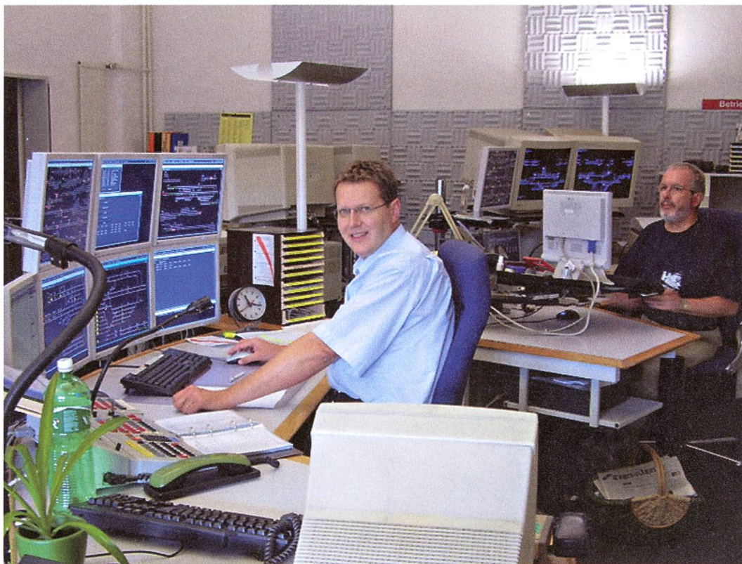
Das neue Fernsteuerzentrum mit vier Arbeitsplätzen und einem Reserveplatz (Aufnahme 2005).

Regionalzentrum für ein grosses Gebiet der Nordwestschweiz ernannt wurde. 1996 waren dieser Leitstelle 136 Mitarbeitende zugeteilt. Zählte man die 170 Mitarbeitenden der übrigen Betriebe dazu, fanden 300 Leute ihre Arbeit hier bei der Bahn.