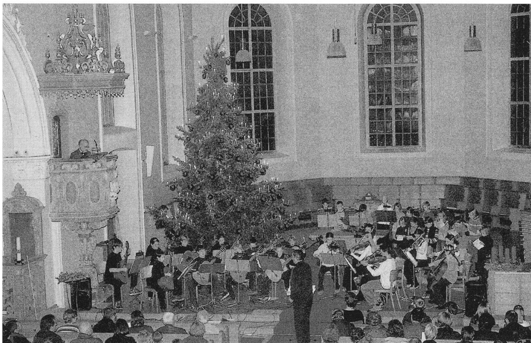
Die städtische Weihnachtsfeier 2003