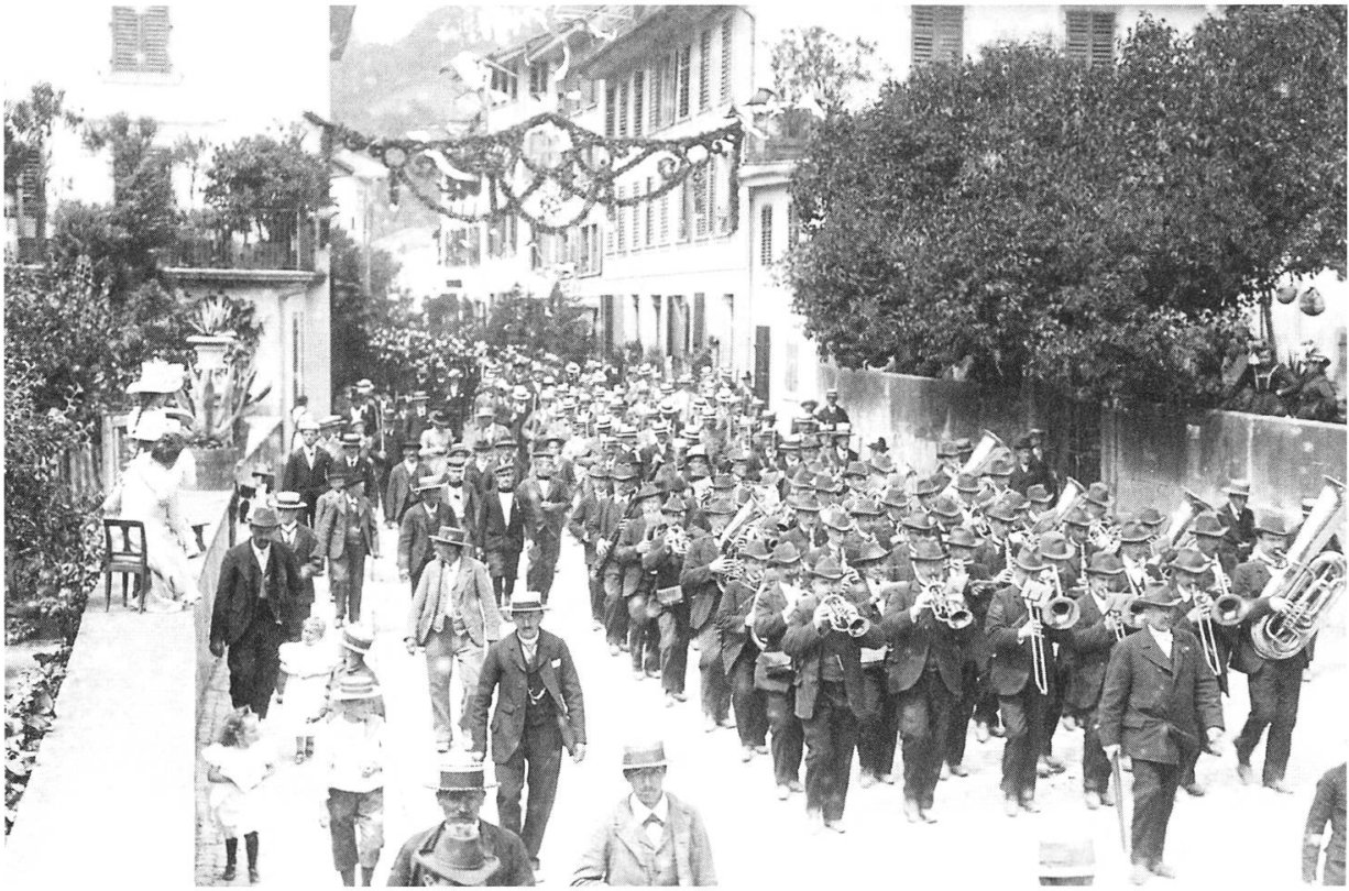
Festumzug durch Brugg anlässlich des kantonalen Schützenfestes.

städtchen und hinterlassen bei den Bewohnern Ärger und Kopfschütteln. Es handelt sich dabei um die Teilnehmer eines offiziellen Automobilrennens von Paris nach Wien.