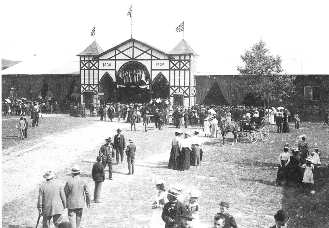
Kantonales Schützenfest Brugg: Eingang zur Festhütte.

Laut Beschluss des Nationalrates vom 9. Juni wird dem Bundesrat das Einbringen einer Gesetzesvorlage empfohlen, wonach inskünftig an Samstagen und an Vorabenden von Feiertagen nur noch neun Stunden, längstens aber bis 17 Uhr, gearbeitet werden darf.