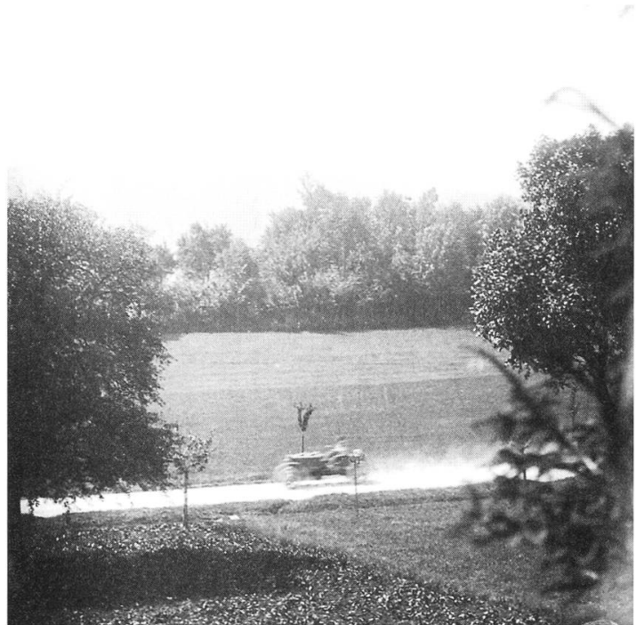
Automobilrennen Paris–Wien: auf rasender Fahrt über den Bözberg.

städtchen und hinterlassen bei den Bewohnern Ärger und Kopfschütteln. Es handelt sich dabei um die Teilnehmer eines offiziellen Automobilrennens von Paris nach Wien.