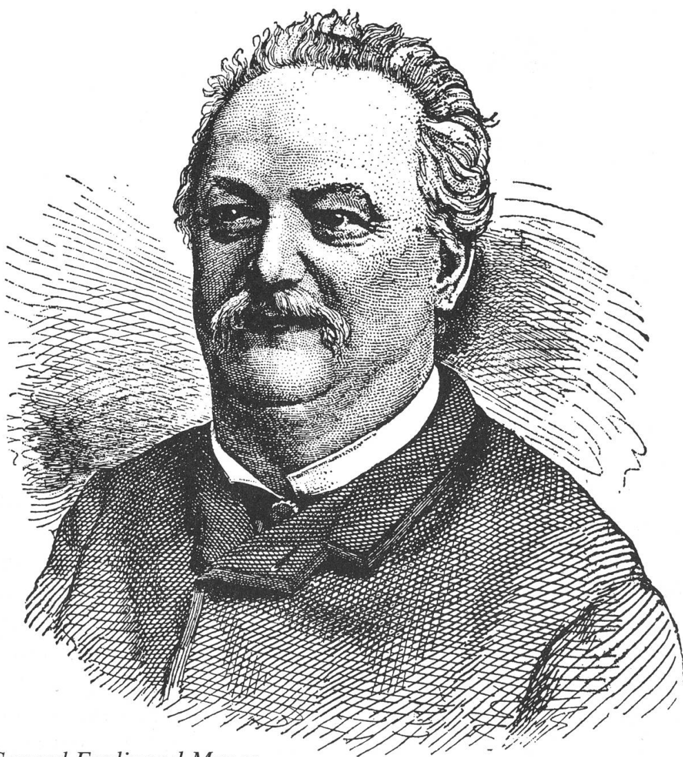
Conrad Ferdinand Meyer

In der Nacht vom 29. auf den 30. November fällt der erste Schnee dieses Winters – allerdings nur in kleinen Mengen. «Trotzdem hat dieser erste Wintergruss Weg und Steg in bedenklich schlechten Zustand gebracht», ist unter den Mitteilungen aus Brugg zu lesen.