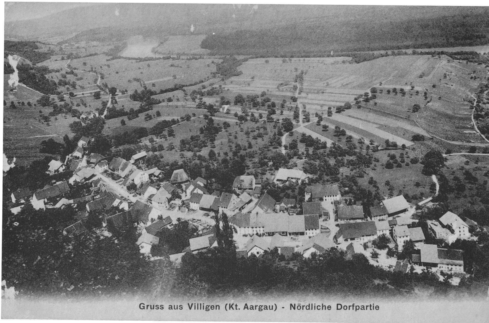
Gruss aus Villigen (Kt. Aargau) - Nördliche Dorfpartie