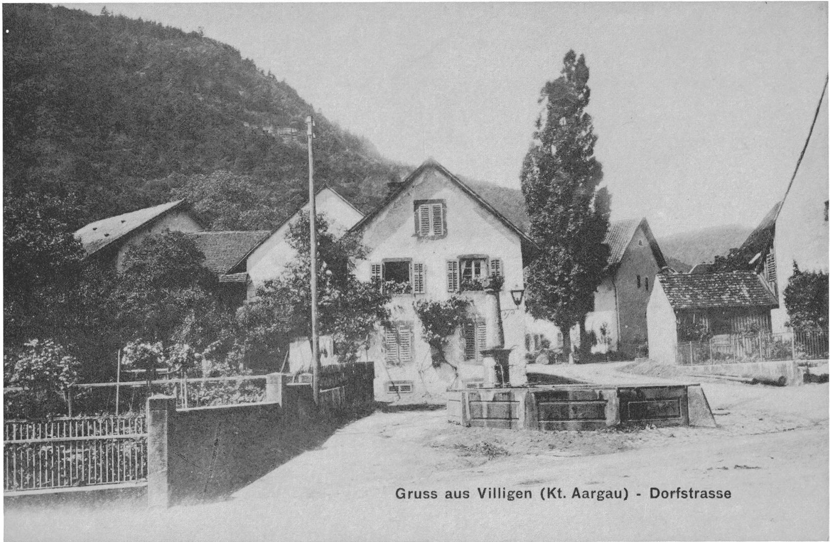
Gruss aus Villigen (Kt. Aargau) - Dorfstrasse