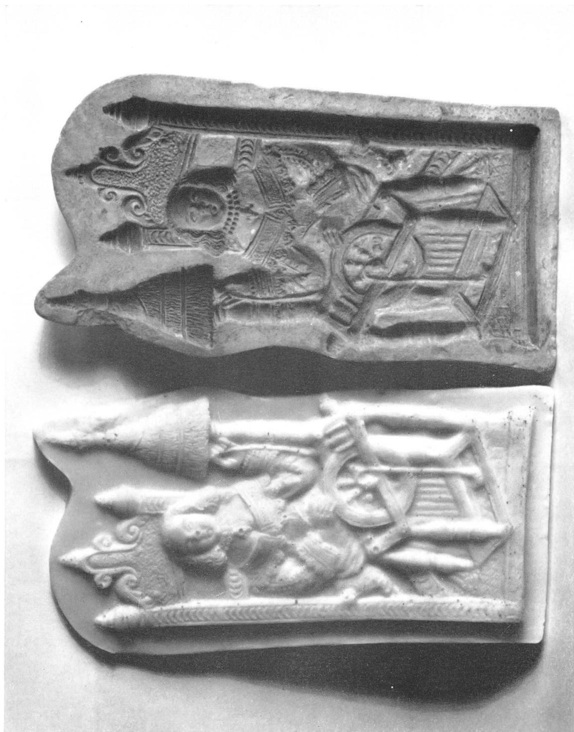
Tafel 7. — Brugg, Heimatmuseum Güetzi-model aus Ton