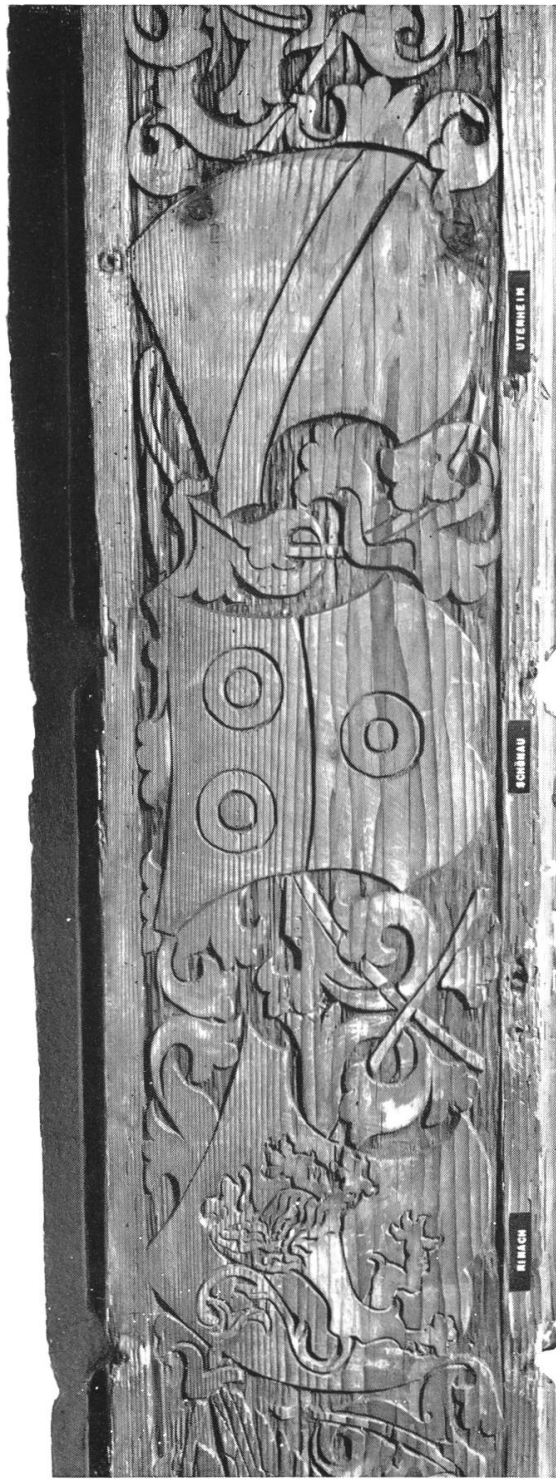
Tafel 3. — Brugg, Heimatmuseum