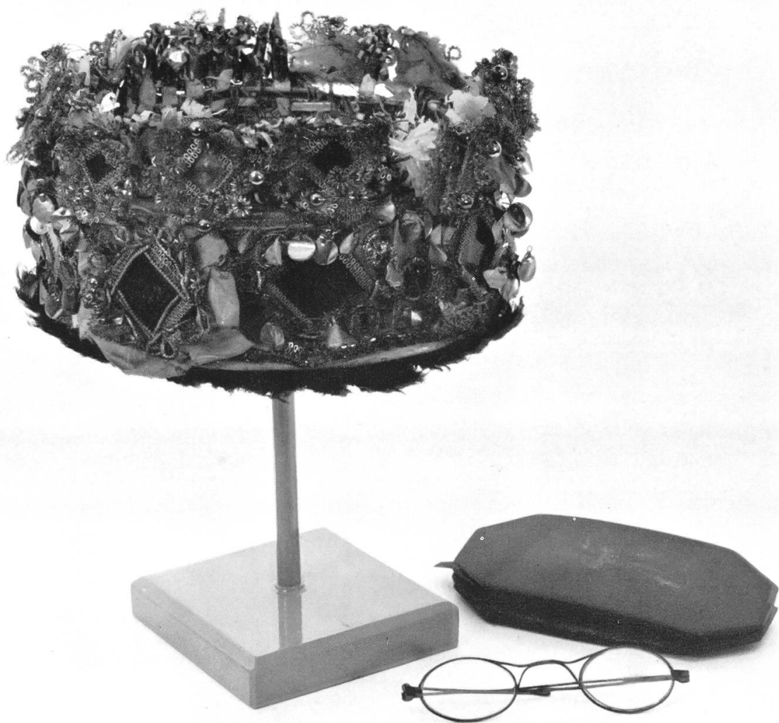
Tafel 8. — Brugg, Heimatmuseum

Brautkrönlein aus Hausen; Brille mit Futteral