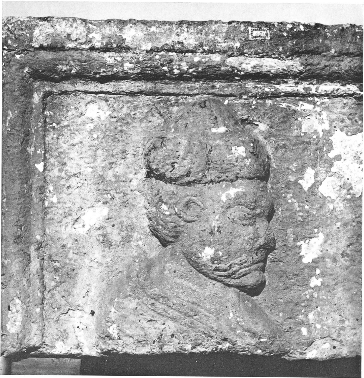
Tafel 2. — Brugg, Heimatmuseum