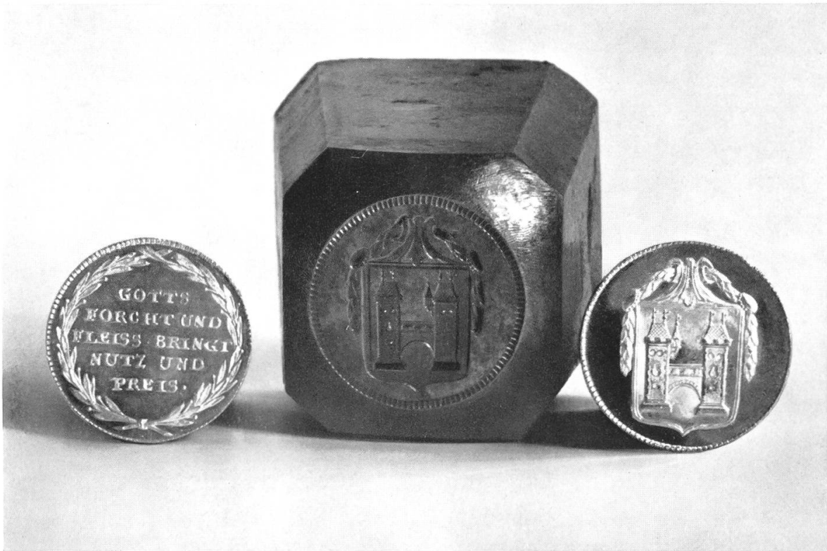
Tafel 6. — Brugg, Heimatmuseum