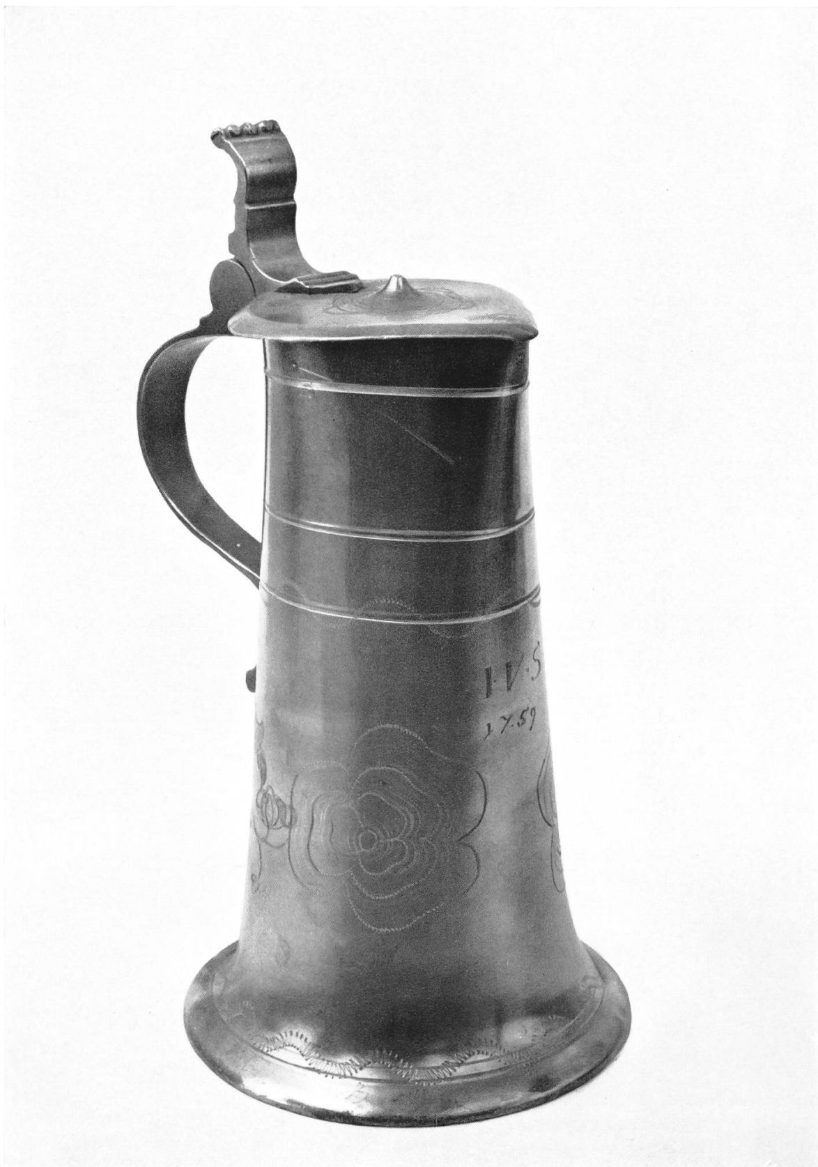
Tafel 5. — Brugg, Heimatmuseum