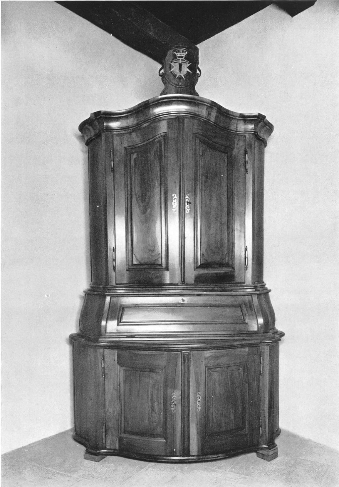
Tafel 4. — Brugg, Heimatmuseum