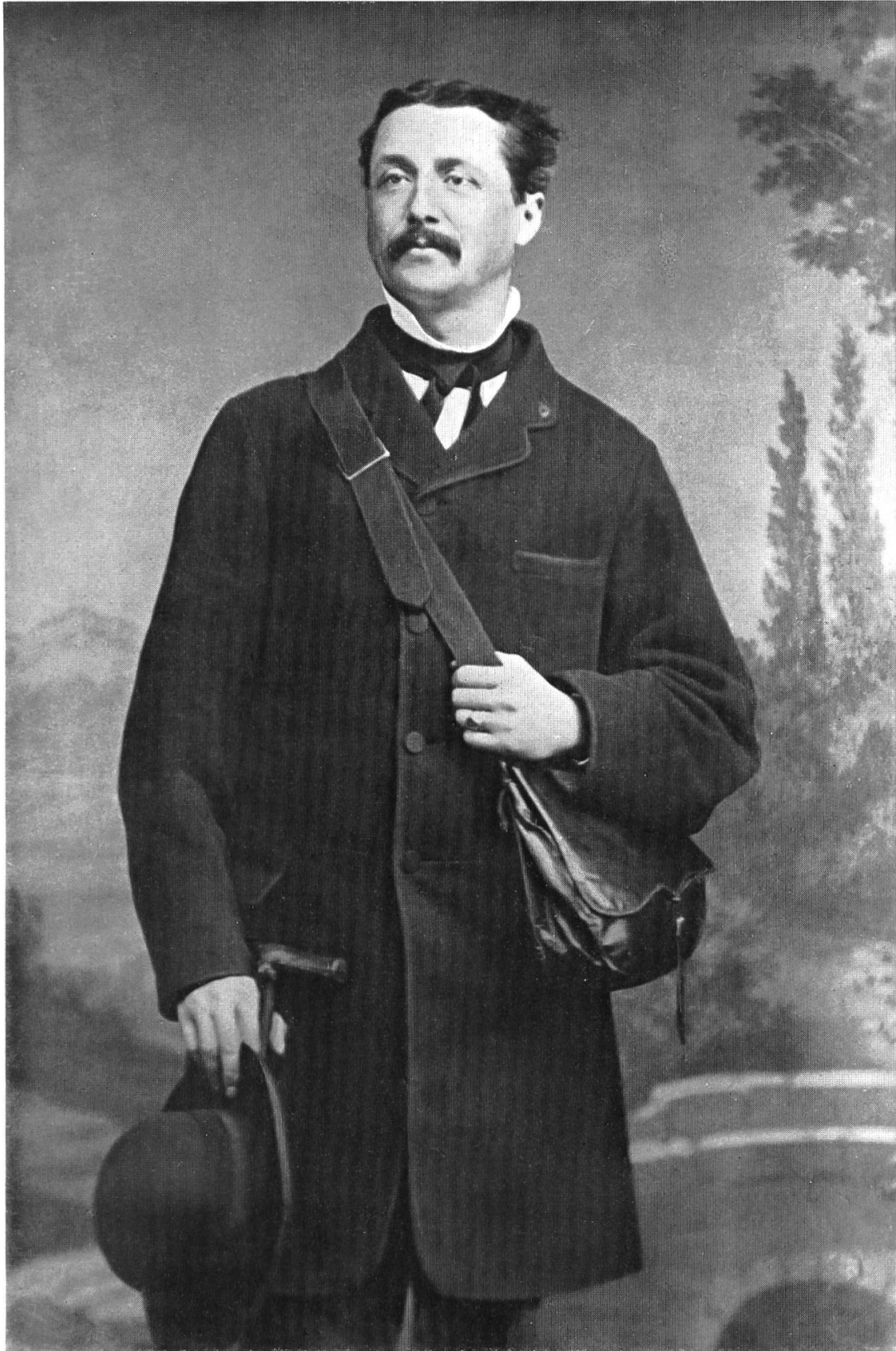
Joseph Viktor Scheffel im Jahre 1864