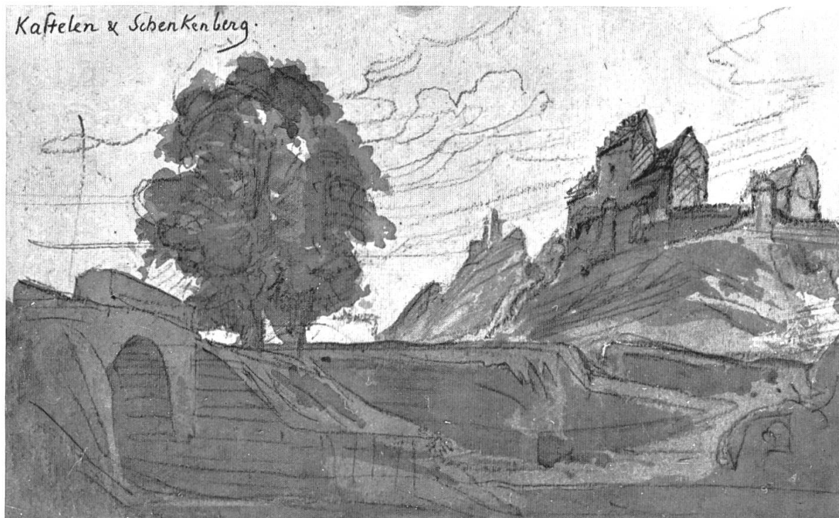
Schloß Kasteln und Ruine Schenkenberg

Zeichnung Scheffels (Scheffel-Archiv Karlsruhe)