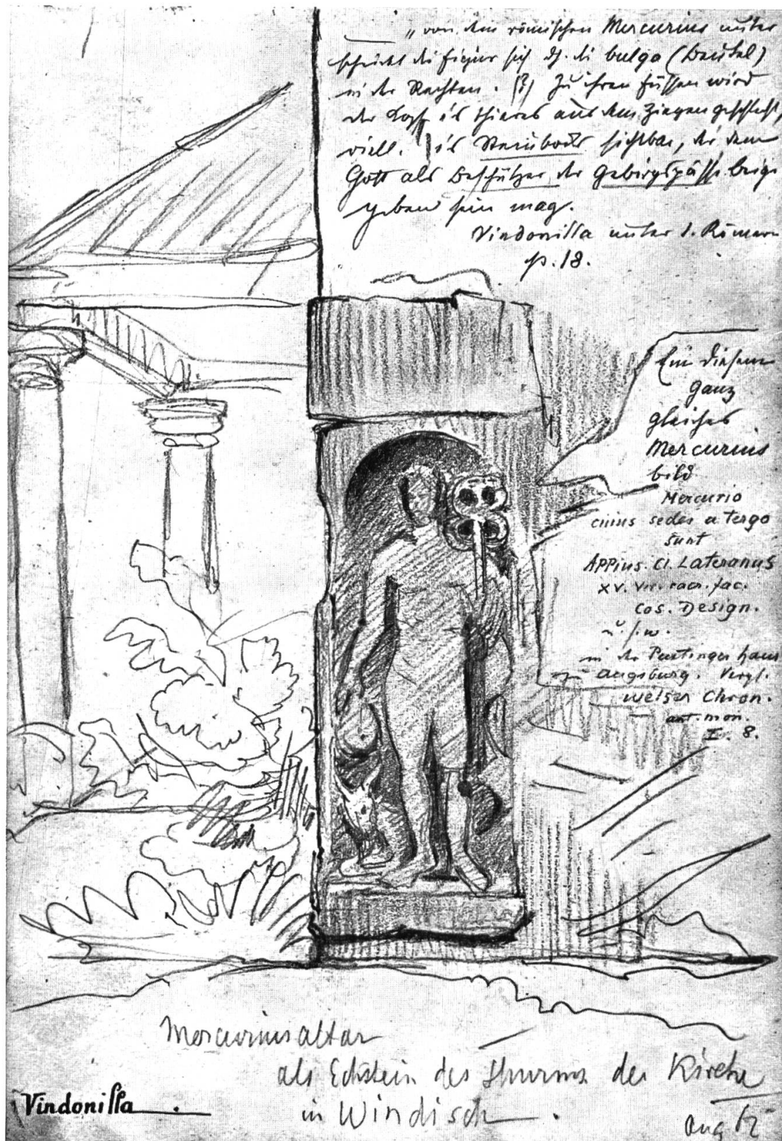
Votivstein für Merkur und die kapitolinische Trias