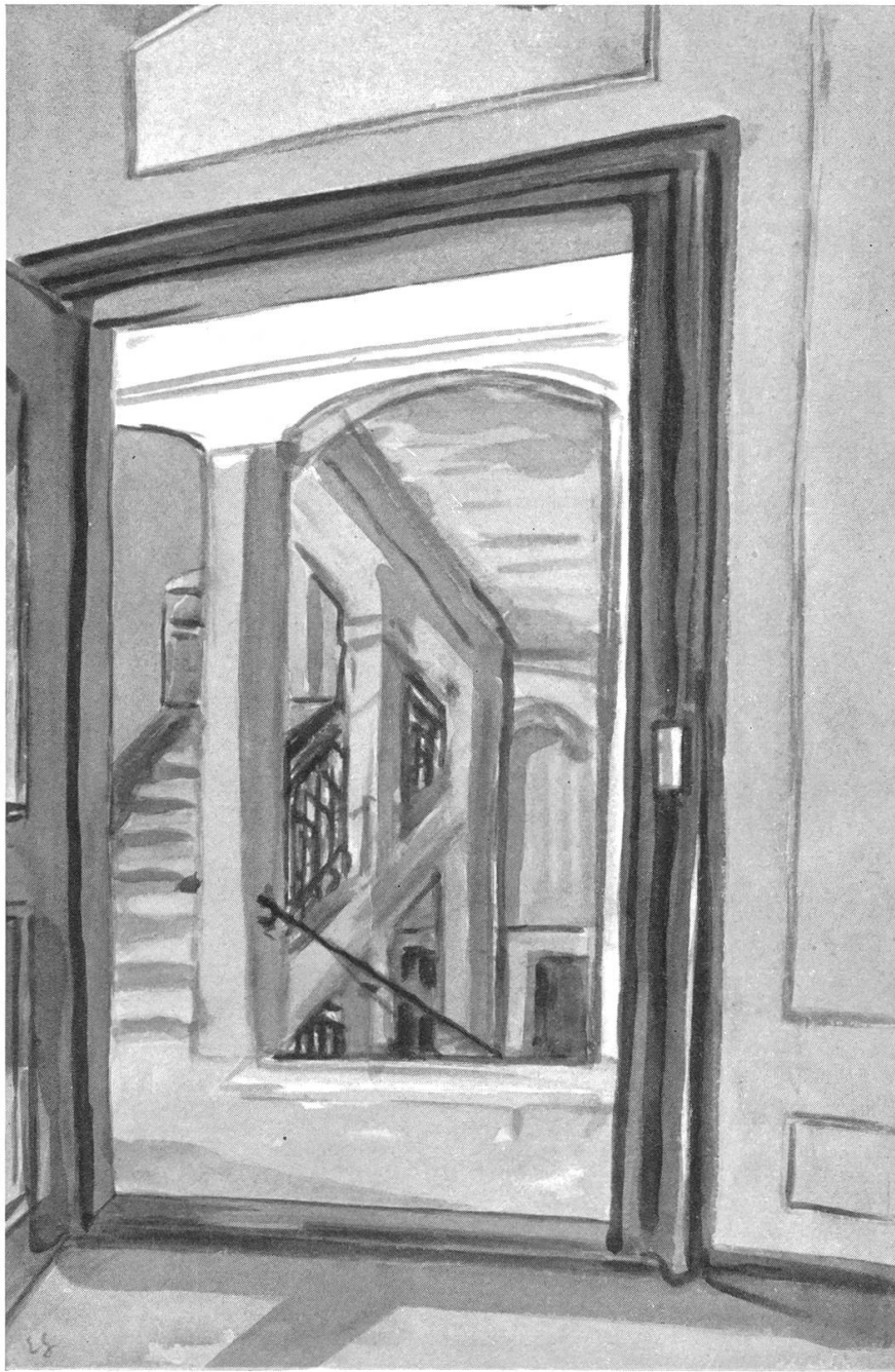
Brugg. — Stadthaus (ehemaliges Geiger-Haus) Blick auf Gang und Treppenhaus aus dem grünen Zimmer im ersten Stock (Aus einer Mappe «Stadthausaquarelle» von Ernst Geiger, in Brugger Privatbesitz)