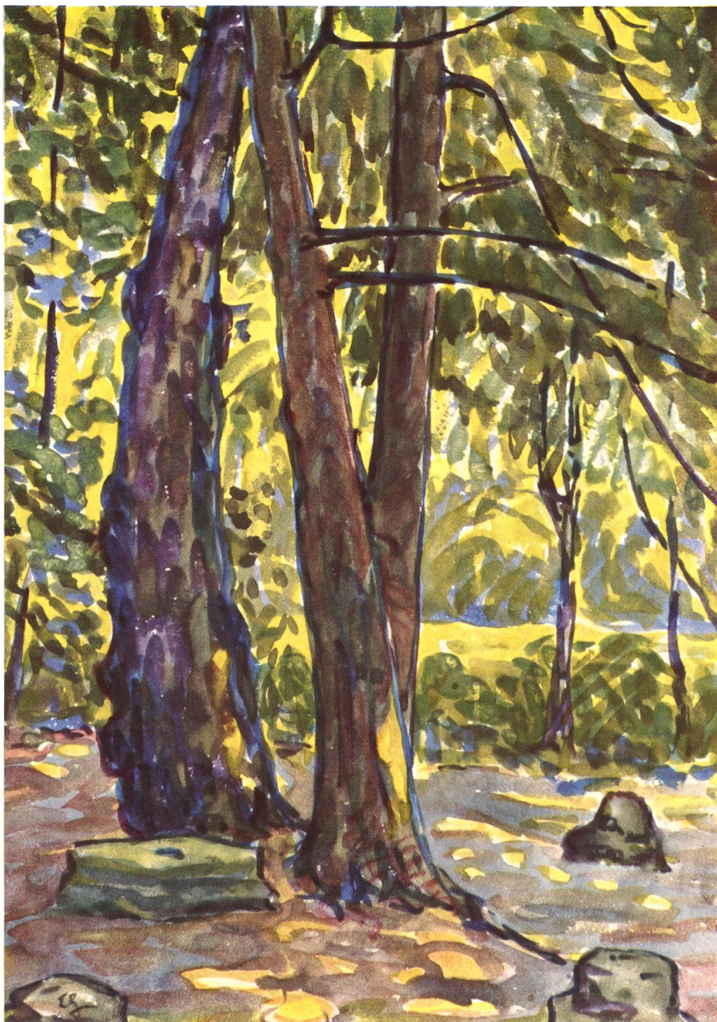
Brugg. — Stadthaus (ehemaliges Geiger-Haus), Park (Aus einer Mappe «Stadthausquarelle» von Ernst Geiger, in Brugger Privatbesitz)