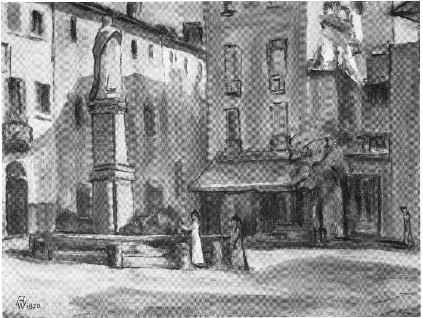
Adolf Weibel, Locarno