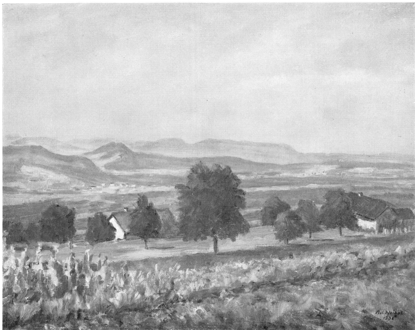
Adolf Weibel, Landschaft bei Bellikon