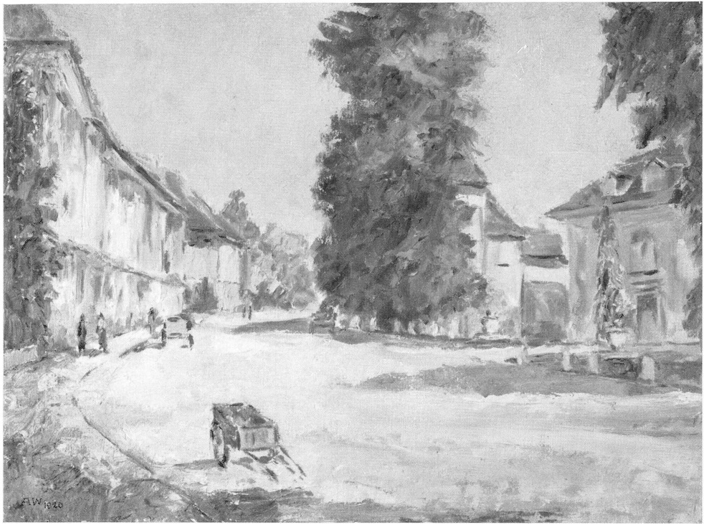
Adolf Weibel, Laurenzenvorstadt in Aarau