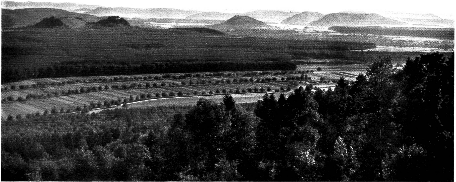
(Bilderkklärung siehe Seite 16)