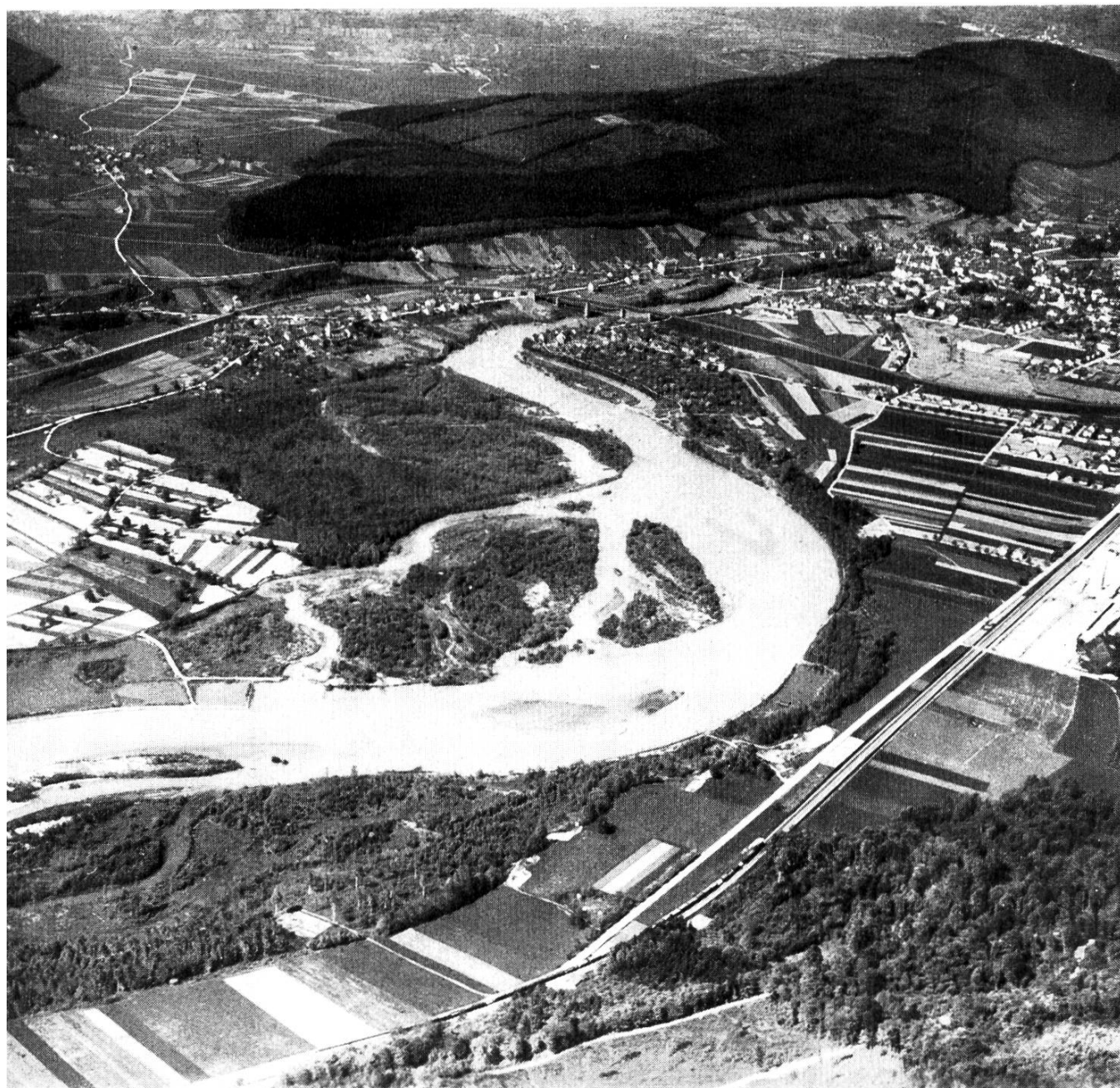
Aarelandschaft oberhalb Brugg