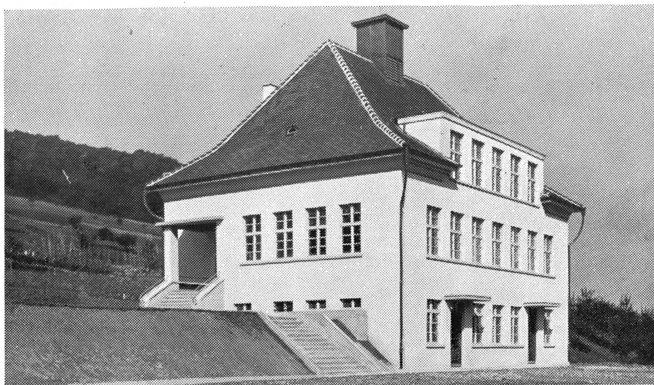
Das neue Schulhaus in Oberflachs