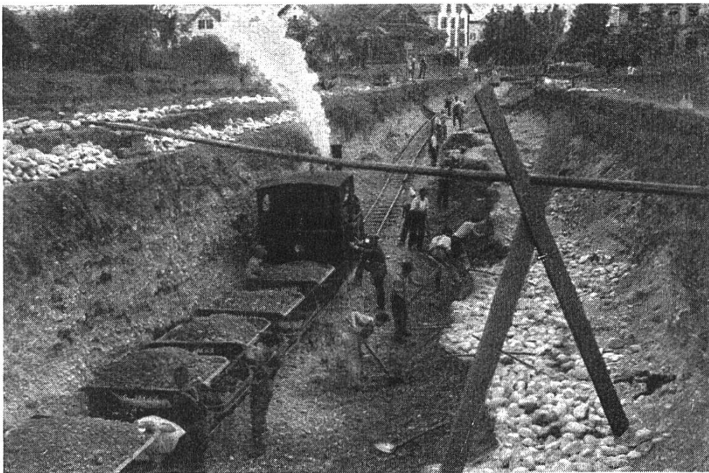
Ausheben der Zufahrtsstraße auf der Brugger Seite.

ganges gedacht war. Auch die ungefähren Kosten wurden berechnet und im Voranschlag total auf 270,000 Fr. geschätzt. Davon fielen 150,000 Fr. zu Lasten der Expropriation und 120,000 Fr. auf Konto des eigentlichen Baues.