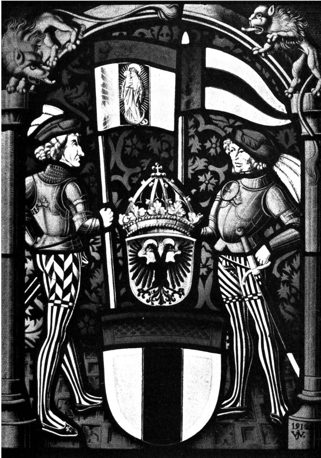
Wappenscheibe der Stadt Baden im restaurierten Tagsatzungssaale. Kopie nach dem Original im ehemaligen Tagsatzungssaale Baden.