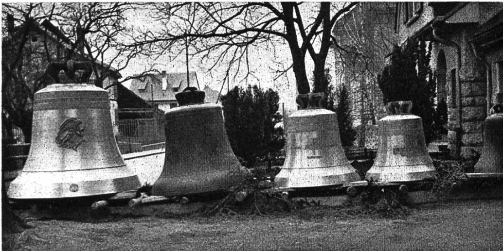
Das neue Geläute.