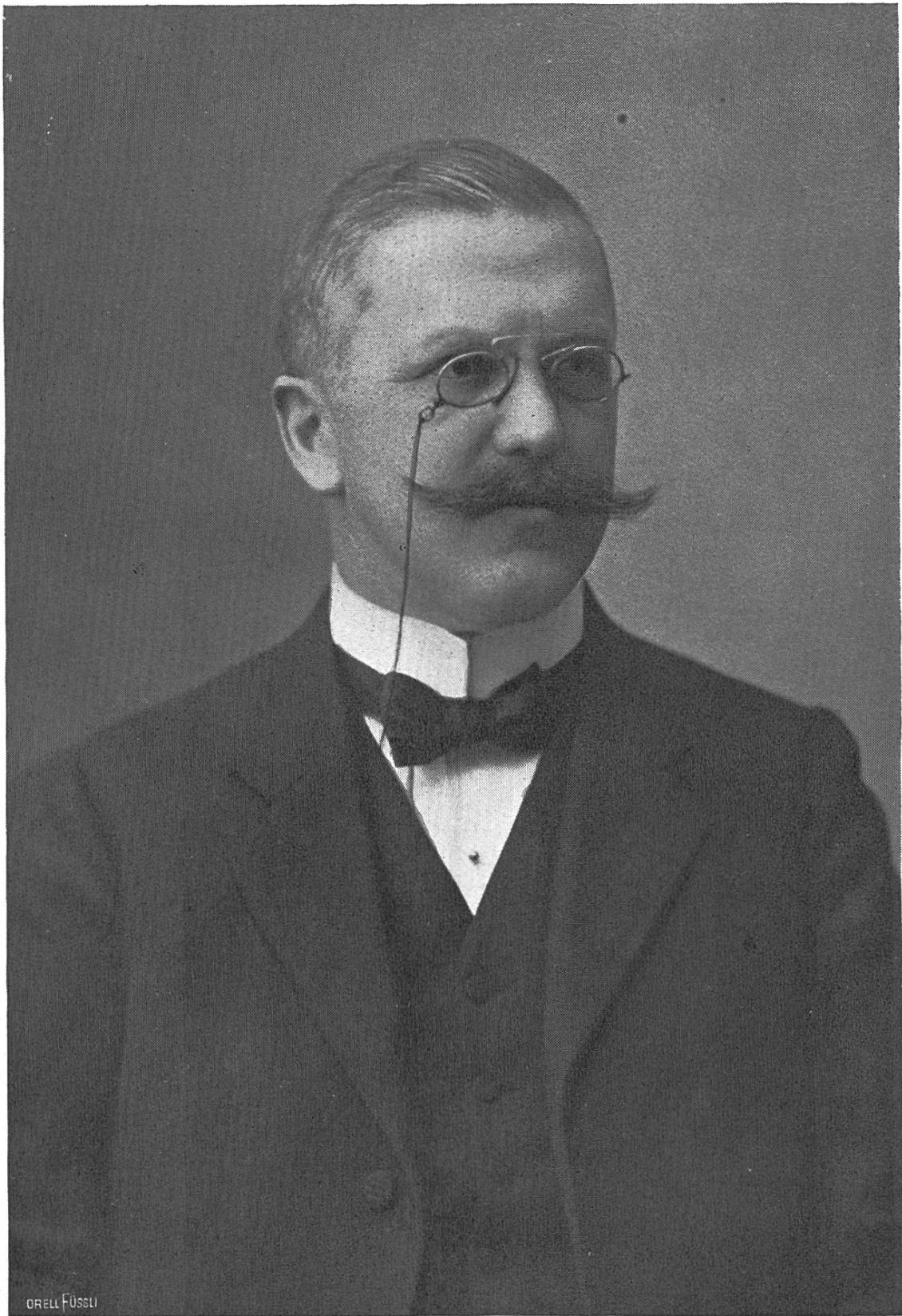
Bundespräsident E. Schulthess.