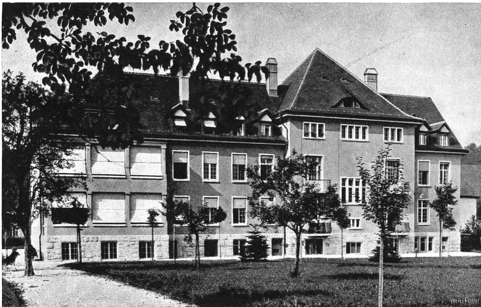
Bezirksspital Brugg. Hauptgebäude.