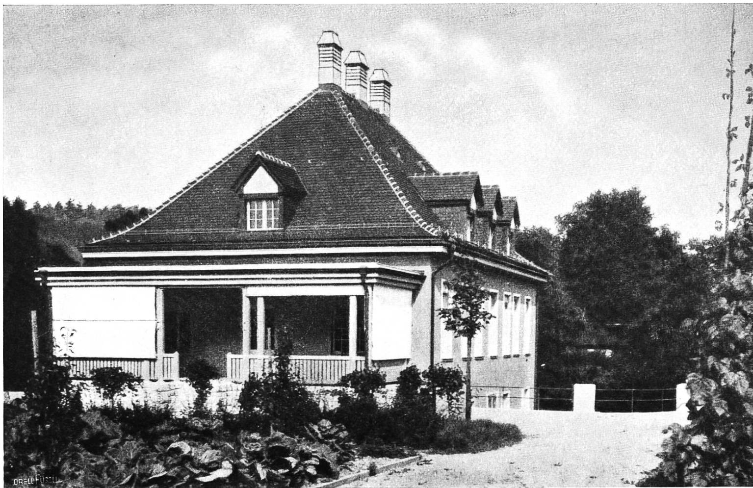
Bezirkspsital Brugg. Absonderungshaus.