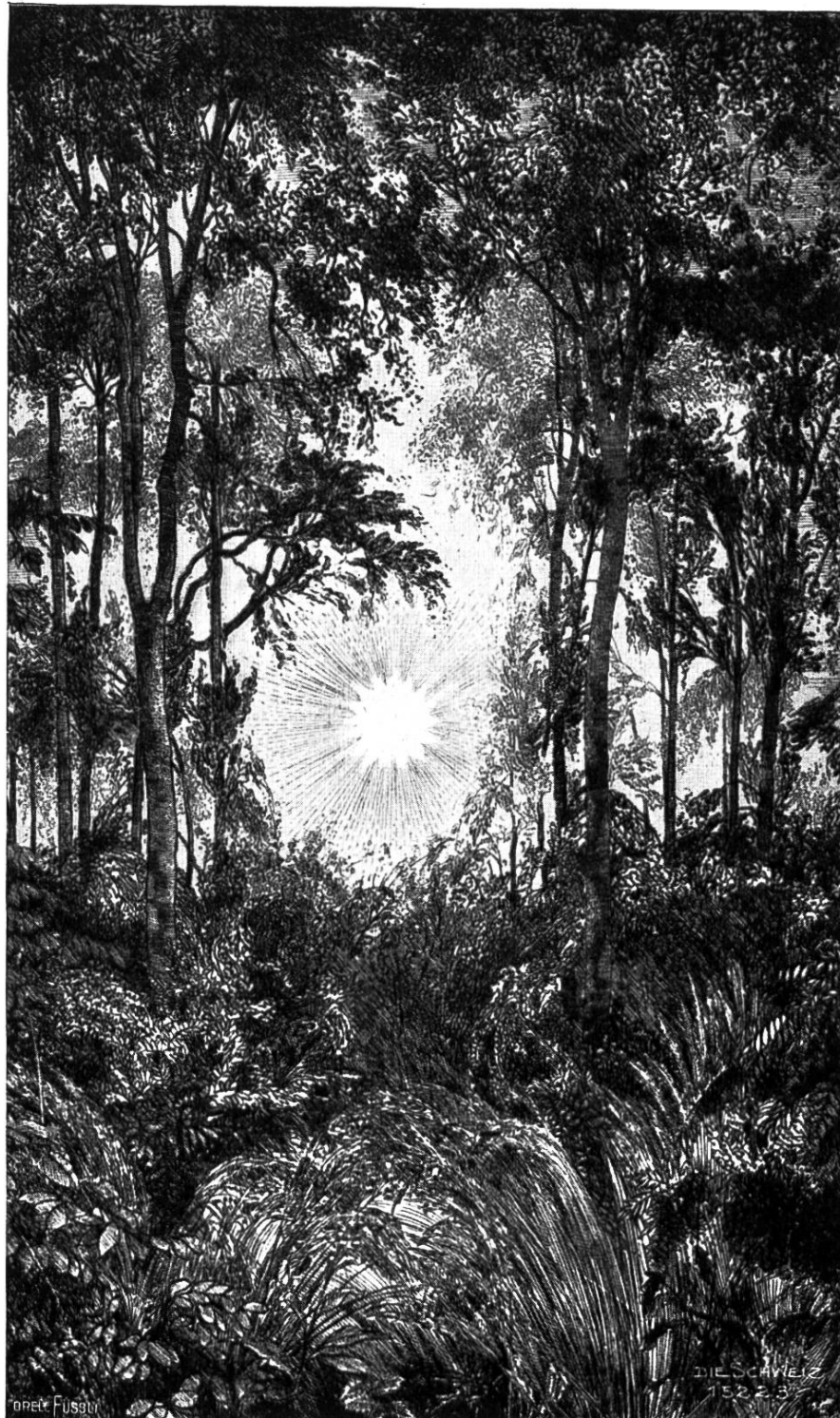
Abendsonne im Wald. (Radierung von E. Anner.)