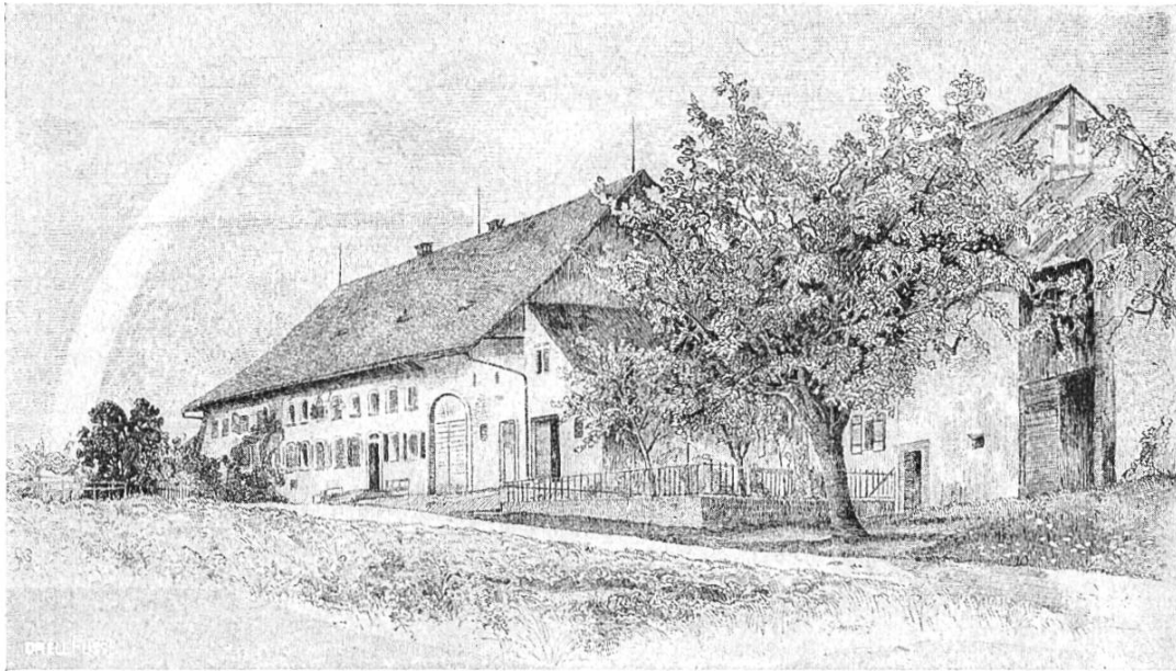
Gasthaus zum Bären auf Stalden (Federzeichnung von E. Inner.)