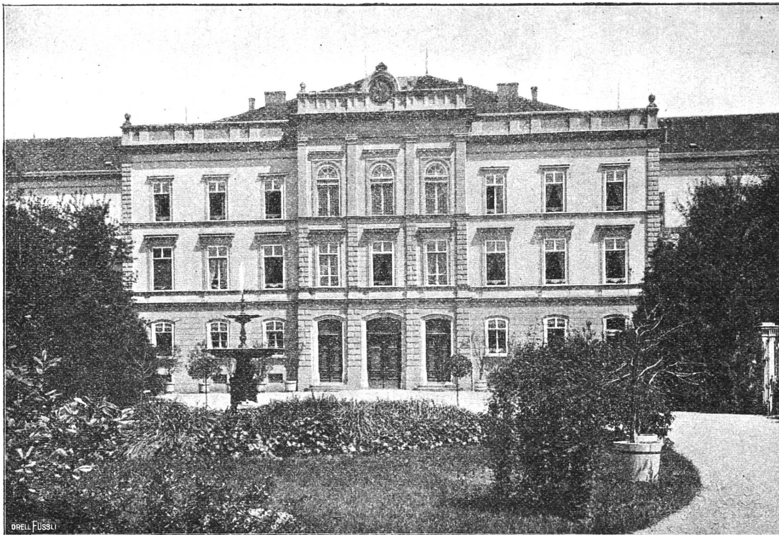
Murgauische Irrenanstalt Königsfelden.