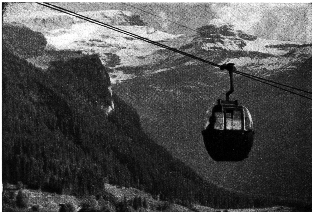
Le télécabine Diablerets-Isenau (durée du parcours 15 minutes)