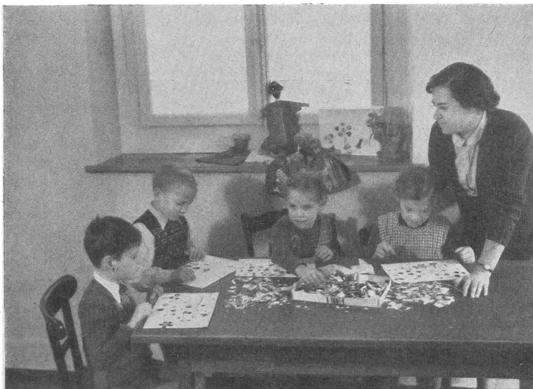
Psychothérapie en groupe

Le traitement psychothérapeutique se fait sous la direction du psychiatre ; les enfants viennent deux à trois fois par semaine à la polyclinique pour les consultations.