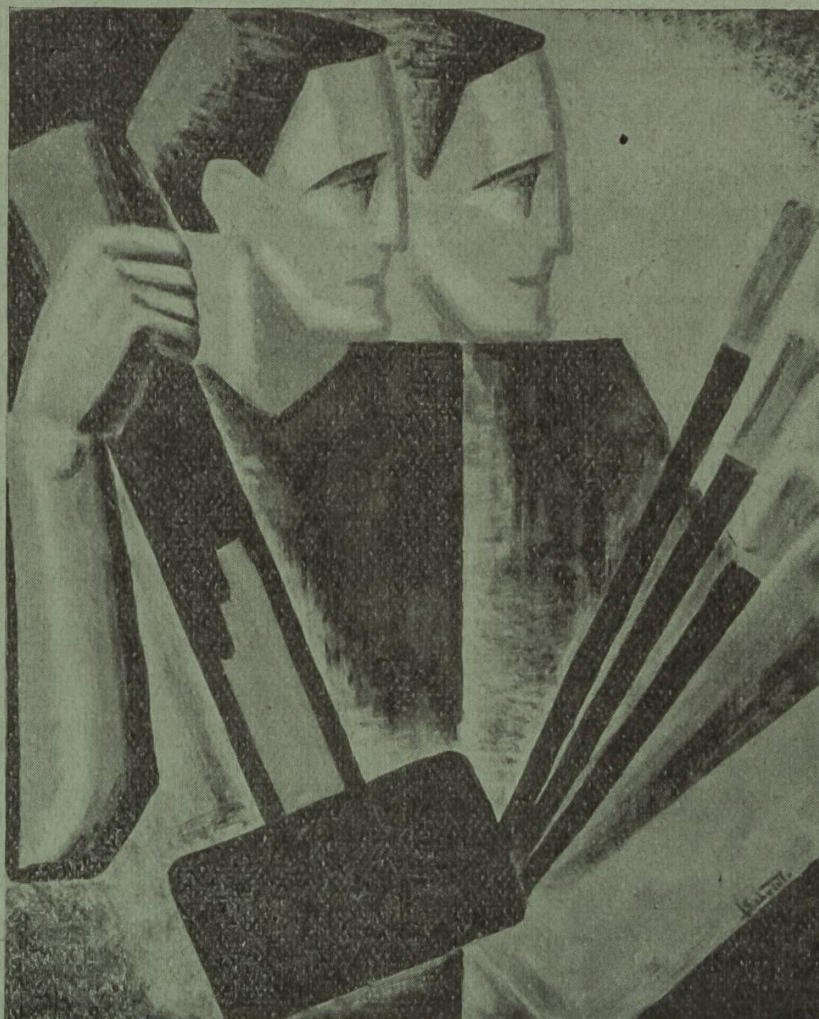
Ecole d'Arts décoratifs