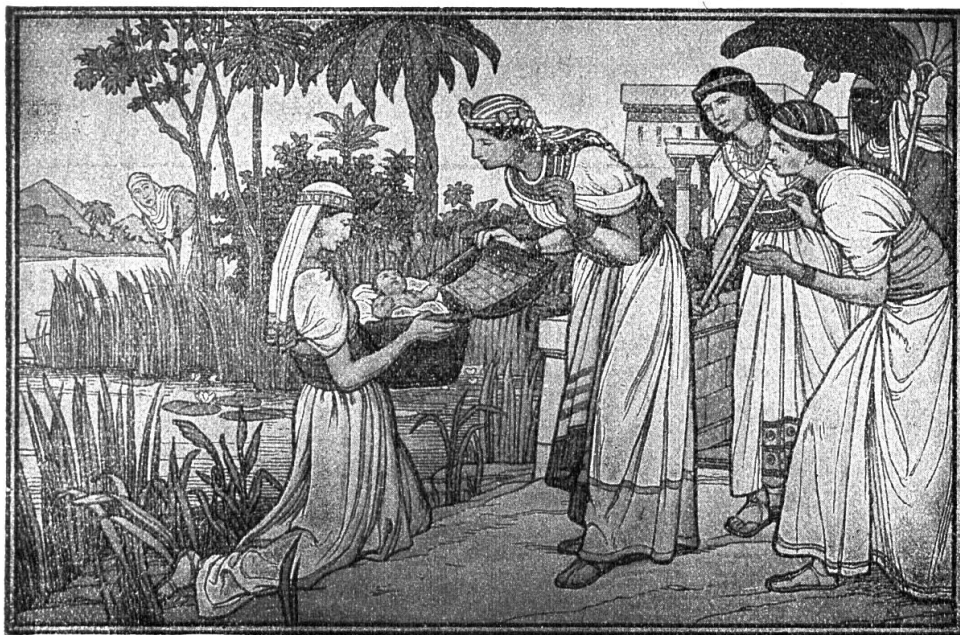
Schumacher : Moïse sauvé des eaux.

L'histoire biblique a obtenu des éditeurs une sollicitude qui n'a pas été prodiguée aux images pour l'enseignement dogmatique. Les instituteurs, pourvus d'excellent matériel