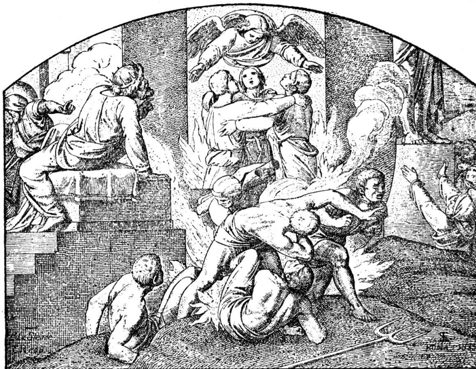
Schumacher : Les trois jeunes gens dans la fournaise.

trop souvent à la lettre de leurs manuels, à l'exégèse plus ou moins claire d'un texte. Oublieux des traditions du passé, ils n'ont réclamé que dernièrement des gravures qui les