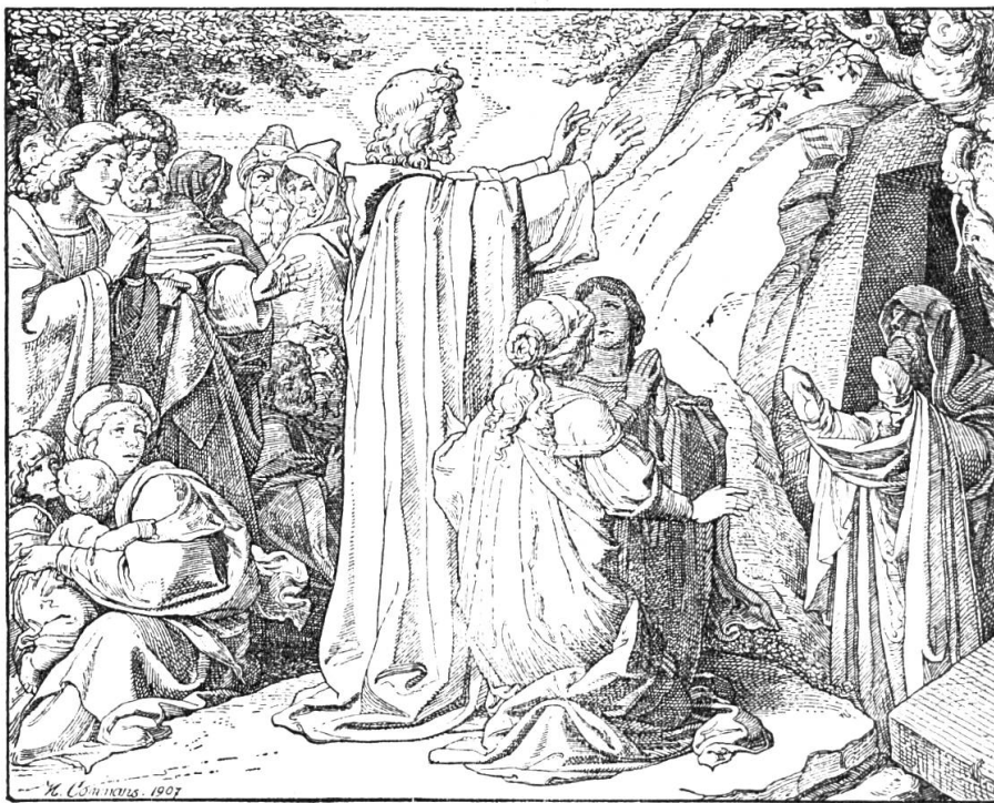
Bible de Düsseldorf : La Résurrection de Lazare.

Nouveau Testament : Annonciation. — Visite de Marie à sainte Elisabeth. — L'Adoration des Bergers. — Présentation de Jésus au Temple. — Fuite en Egypte. — La Tradition du pouvoir des clefs. — Le bon Samaritain. — Jésus, l'ami des