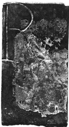
Fig. 2a et b. Plaquette en bronze. Inv. 1908/4638. Ech. 1:1.