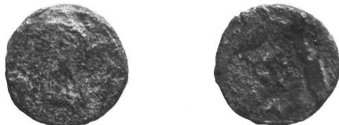
Fig. 8. Les monnaies de la nécropole du Marais (échelle 1 : 1).