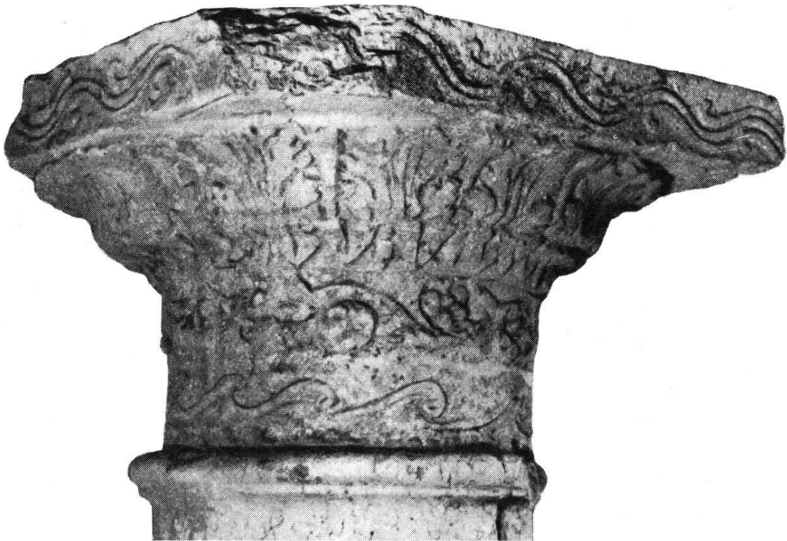
Fig. 5b — Chapiteau au Musée d'Avenches.

lavis de 28 × 39 cm, échelle en pieds et en modules, intitulé « Chapiteau antique de marbre blanc, découvert à Avenches au mois de mai 1804 », signé « Aubert Parent del. Aventicum Helvetiorum 1804 ». Exécution maladroite (perspective !). L'ornement inférieur de la colonne est rendu d'une façon différente de celle qu'on observe dans les deux autres dessins.