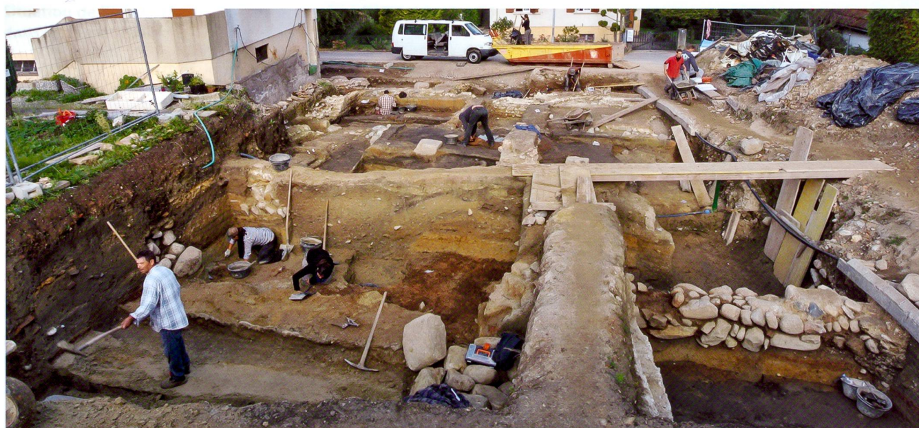
Fig. 1 Insula 15. Vue générale de la fouille réalisée en 2013 dans l'angle sud-ouest de l'îlot.