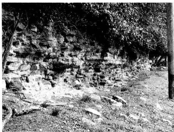
Fig. 4. Le Mur d'enceinte Au Lavoir.