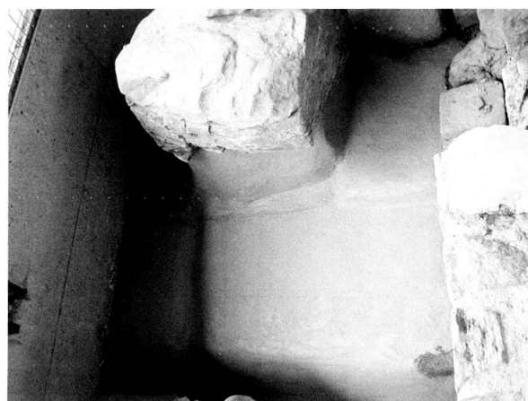
Fig. 1. Les Thermes de Perruet. Appareil de molasse restauré du prae-furnium sud du tepidarium .

Aux Thermes de Perruet (insula 29), S. Bigović a procédé à plusieurs campagnes de désherbage, mais a dû lutter contre un fléau qui reste à maîtriser : les pigeons ; leur guano attaque les dalles de terre cuite ou de calcaire et il faut l'enlever à la brosse métallique, ce qui dégrade la surface des matériaux antiques. Une solution est à l'étude avec le Service des bâtiments pour empêcher que ces volatiles indésirables viennent nicher sous le vaste abri protégeant les