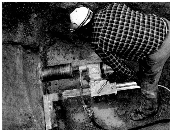
Fig. 7. Installation d'un drainage au travers du mur périmétral de l'amphithéâtre.