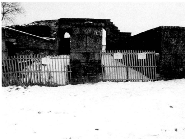
Fig. 6. La Porte de l'Est, dont on a dû condamner deux passages, suite à la dégradation des restaurations anciennes.