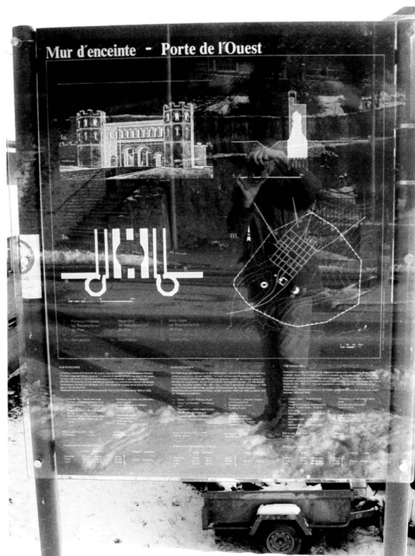
Fig. 11. Le panneau d'information de la Porte de l'Ouest avec son nouveau verre de protection.

Le panneau d'information de la Porte de l'Ouest, soumis aux pollutions de la route de contournement du Faubourg, a été remplacé par un son exemplaire de réserve, et l'on a substitué à son plexiglas de protection, devenu opaque, un verre renforcé qui devrait rester transparent (fig. 11).