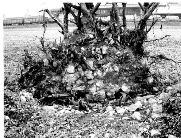
Fig. 5. Le Mur d'enceinte Vers la Gare, endommagé par la chute d'un arbre enraciné sur sa maçonnerie.

Il a fallu clôturer un secteur du mur d' analemma ouest pour en écarter les visiteurs (fig. 2). Des panonceaux interdisant l'escalade des murs ruinés ont été installés en deux emplacements du monument. Il faudra compléter cette signalétique par une interdiction de faire du feu, les foyers se multipliant aux dépens des maçonneries antiques.