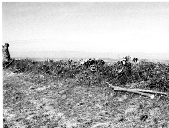
Fig. 3. Le Mur d'enceinte après débroussaillage, le long de la route de Donatyre.