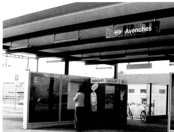
Fig. 9. Le quai de la gare CFF et son nouvel aménagement, avec le panneau d'information touristique.

maçonneries, antiques ou reconstruites, du mur périmétral de l'amphithéâtre ont pu sécher, consolidant les restaurations dont elles avaient été récemment l'objet. Pour évacuer vers l'extérieur les eaux d'infiltration, il a fallu forer en deux points l'assise de fondation de grès coquillier (fig. 7), au-dessous des niveaux de circulation antiques.