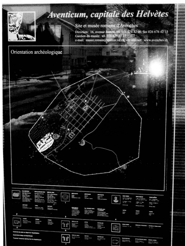
Fig. 10. Le panneau d'information touristique de la gare CFF.