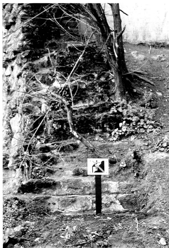
Fig. 12. Un panonceau d'interdiction d'escalader les ruines, ici à l'amphithéâtre.