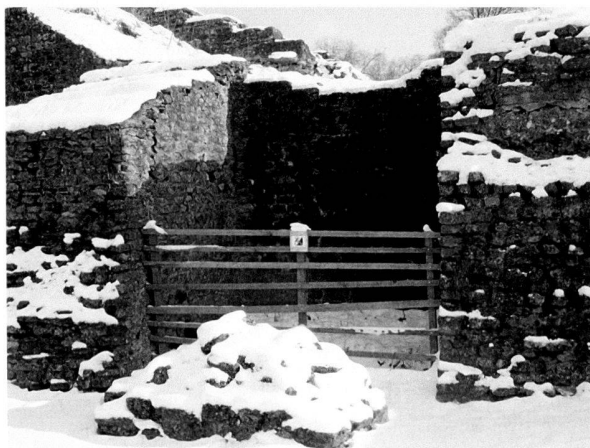
Fig. 2. Le Théâtre. Un secteur clôturé en raison des risques d'effondrement d'un parement anciennement restauré.