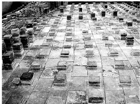
Fig. 2 Les Thermes de Perruet. Le sol restauré du tepidarium .