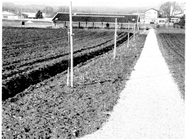
Fig. 3 Les Thermes de Perruet, vue du nouveau chemin d'accès à partir des Conches-Dessus.

d'accès piétonnier aux Thermes du forum a pu être réalisé en décembre 2003 (fig. 3). Prolongeant vers le Sud la desserte automobile du dépôt de la Voirie cantonale à partir de la RC 601 et longeant à l'Est le périmètre aménagé des thermes, il rejoint le réseau de nouvelles voies créées par le syndicat d'améliorations foncières Donatyre-Avenches, en particulier celle qui traverse les Conches-Dessus à partir de