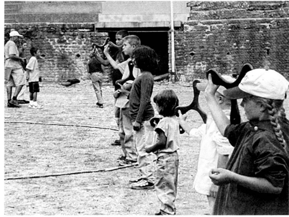
Fig. 5 Démonstration de boomerang à l'amphithéâtre.

Au Théâtre, la traditionnelle fête du 1 er août a remporté son habituel succès. Du 21 au 24 août 2004, l'association Hepta.aero a présenté toute une série de documentaires sur l'aviation de 1908 à 1939 dans le cadre de son 1 er Fly by night Open air cinema . Au prix d'un aménagement minimal, ces projections vidéo sur grand écran ont réuni un