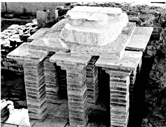
Fig. 1 Les Thermes de Perruet, tepidarium , angle Nord-Ouest. Etat achevé de la reconstitution du dispositif complet de l'hypocauste.

Grâce à une bonne collaboration entre Site et musée romains, la municipalité d'Avenches et les services de l'Etat, le projet déjà ancien de réaliser un nouveau chemin