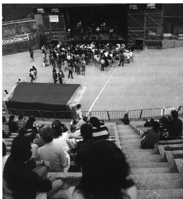
Fig. 2. Concert de RockOz'Arènes.

représentations de la Traviata de G. Verdi, de deux représentations de La Bohème de G. Puccini et d'une soirée où fut chantée la Messa da requiem de G. Verdi. Si les deux premières de la Traviata , les 4 et 5 juillet, furent annulées en raison du mauvais temps, deux supplémentaires en furent données les 15 et 17 juillet (fig. 1). Le public, moins nombreux qu'espéré, et le budget très lourd de ce riche programme ont mis en difficulté l'Association des Arènes, qui devra sans doute transmettre à d'autres organisateurs la responsabilité de mettre sur pied, du 3 au 22 juillet 1998, le 4 e festival, avec au programme Turandot de G. Puccini et Le Barbier de Séville de G. Rossini.