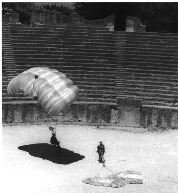
Fig. 4. Atterrissage d'un parachutiste de l'armée suisse dans l'amphithéâtre.

Le 22 septembre, ce sont près de 1'000 scouts vaudois qui ont fêté, sous l'œil attendri de leurs parents, le 85 e anniversaire de leur association.