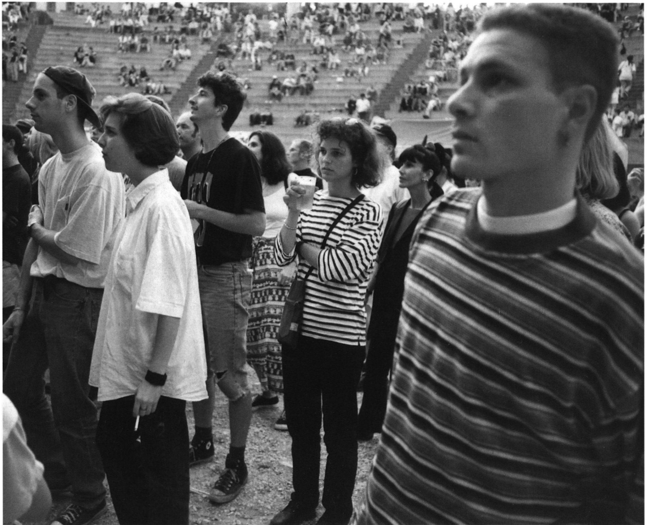
Fig. 3. Concert de RockOz'Arènes.