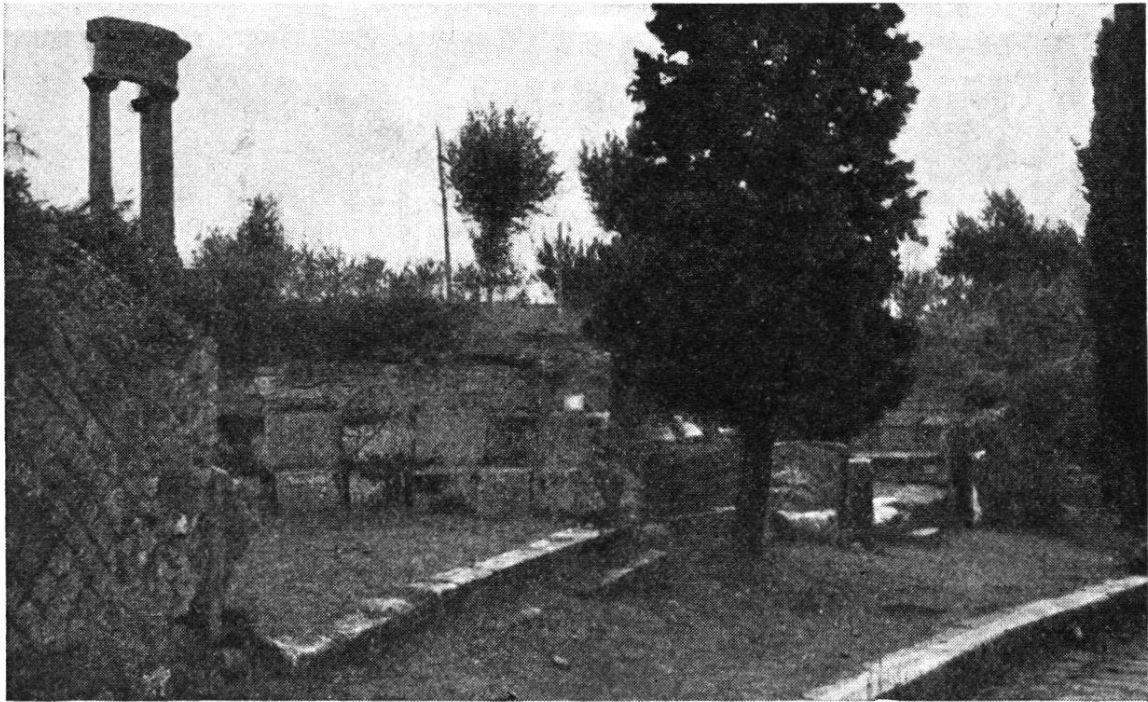
Fig. 2. — Schola servant de monument funéraire, devant la porte de l'Herculaneum à Pompéi.

quelque vivant ou d'un mort, n'est pas nette du tout 1 . Il n'y a donc rien d'extraordinaire dans le fait que ce banc semi-circulaire, si commode pour la conversation, ait servi aussi pour l'enseignement : le maître assis au milieu, chacun des élèves pouvait alors de sa place prendre part à la discussion, sans tourner le dos à aucun de