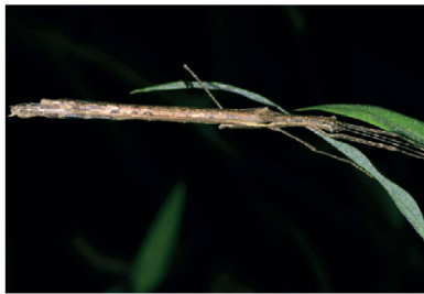
Indet. não indetificado sp. 1