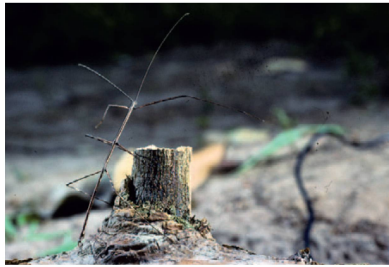
Phasmatidae Cladomorphus phyllinum