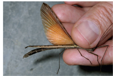
Indet. não indetificado sp. 2