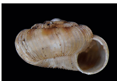
Charopidae Lilloiconcha cf. gordura- sensis [2 mm]