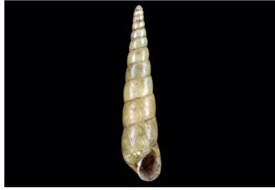
Subulinidae Obeliscus cf. carphodes [55 mm]