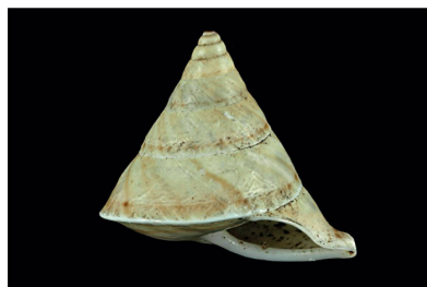
Bulimulidae Oxychona bifasciata [20 mm]