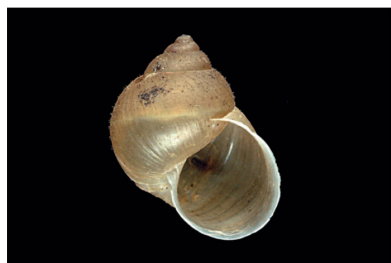
Bulimulidae Rhinus velutinohispidus [20 mm]