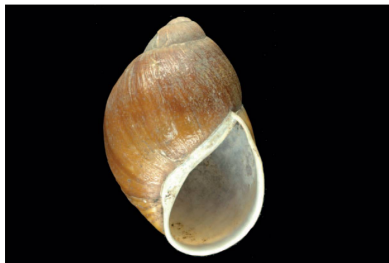
Megalobulimidae Megalobulimus aff. garbeanus [60 mm]