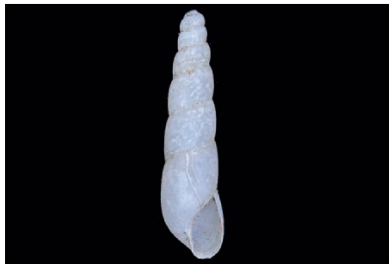
Subulinidae Stenogyra cf. octogyra [5 mm]