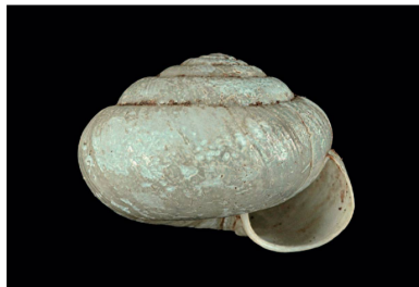
Streptaxidae Streptaxis subregularis [20 mm]