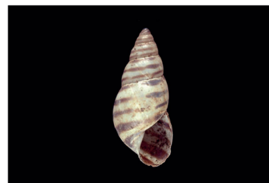
Bulimulidae Drymaeus cf. poecilus [40 mm]