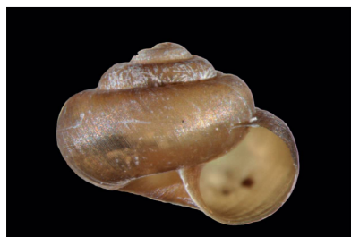
Charopidae Charopidae sp. 1