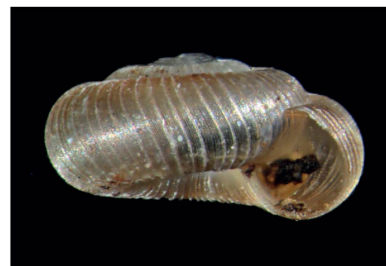
Charopidae Radiodiscus sp. 2 [1 mm]