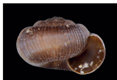
Charopidae Radioconus amoenus [2 mm]