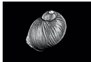
Amphibulimidae Simpulopsis sp. 2 [15 mm]