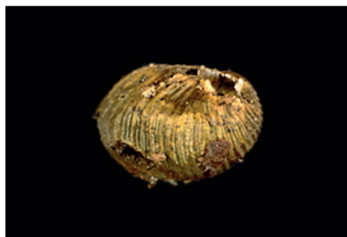
Amphibulimidae Simpulopsis sp. 1 [10 mm]