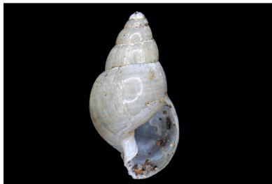
Subulinidae Leptinaria cf. unilamellata [13 mm]