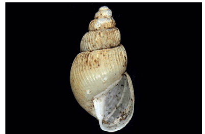
Subulinidae Synapterpes sp. 1 [15 mm]