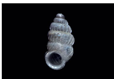
Diplommatinidae Adelopoma sp. 1 [2 mm]