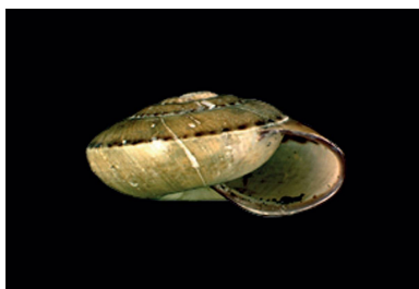
Solaropsidae Solariopsis pascalina [40 mm]