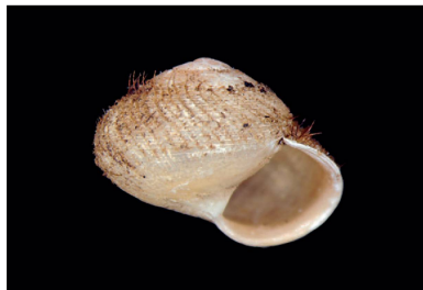
Helicinidae Alcadia sp. 1 [4-5 mm]