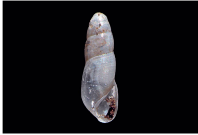
Ferussaciidae Cecilioides cf. consobrina [3 mm]