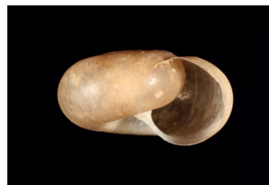
Solaropsidae Psadara sp. 1 [10 mm]