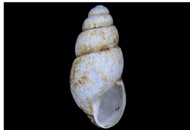
Subulinidae Leptinaria sp. 1 [5 mm]