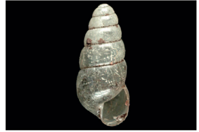
Subulinidae Allopeas cf. micra [10 mm]