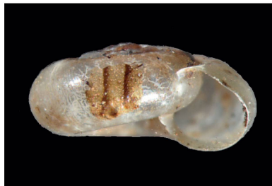
Systrophiidae Scolodonta spirorbis [2 mm]