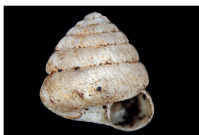
Charopidae Lilloiconcha superba [3,5 mm]