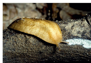
Veronicellidae Sarasinula sp. 1