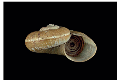
Megalomastomidae Aperostoma cf. blanchetiana [25 mm]