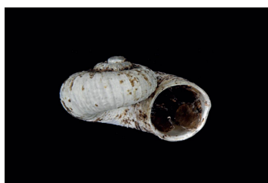
Megalomastomidae Cyclopomops sp. 1 [5 mm]