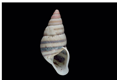
Bulimulidae Drymaeus flexilabris [30 mm]