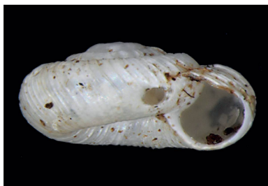
Charopidae Radiodiscus sp. 1 [1,5 mm]