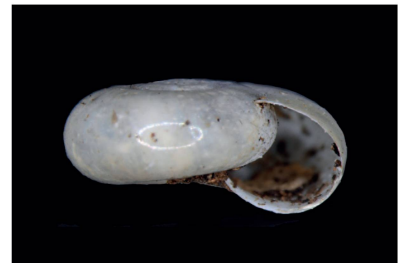
Systrophiidae Tamayoa banghaasi [5 mm]