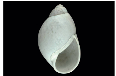
Megalobulimidae Megalobulimus oliveirai [83 mm]