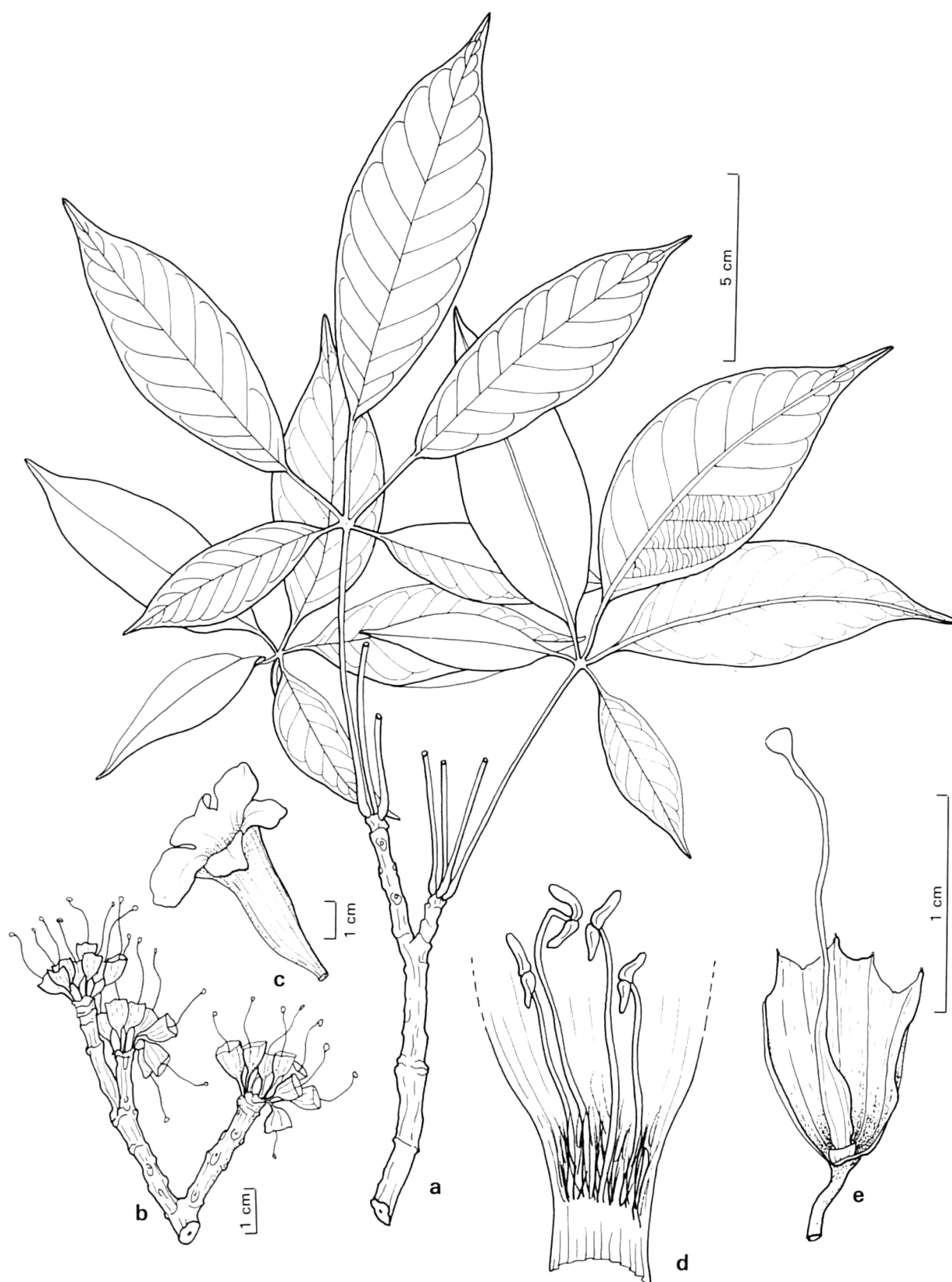
Fig. 222. — Tabebuia incana A. Gentry (Marmillod M-9): a) ramita; b) inflorescencia con las corolas caídas; c) corola; d) corte longitudinal de la base de la corola; e) corte longitudinal de la base del cáliz.