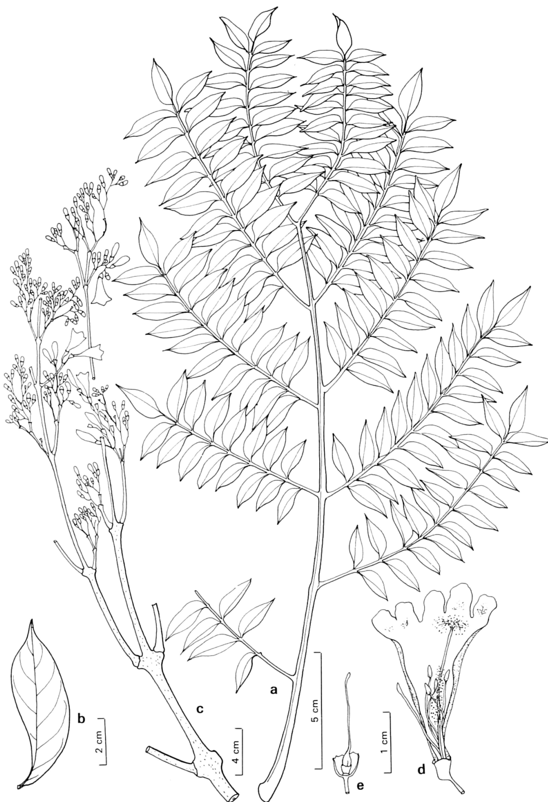
Fig. 220. — Jacaranda copaia (Aublet) D. Don subsp. spectabilis (C. Martius ex DC.) A. Gentry (Árbol 5/550): a) hoja; b) folíolo; c) inflorescencia; d) corte de la corola; e) gineceo.