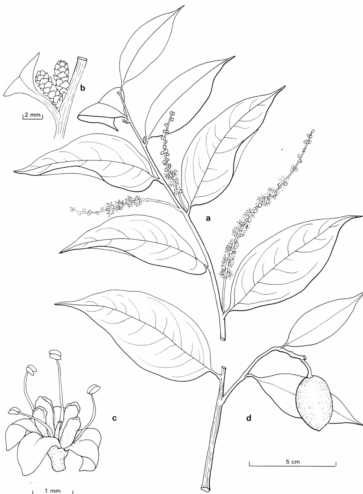
Fig. 47. — Agonandra silvatica Ducke (Krukoff 9006): a) ramita terminal e inflorescencias. (Árbol 1/190); b) yemas; c) flor; d) ramita fructífera.