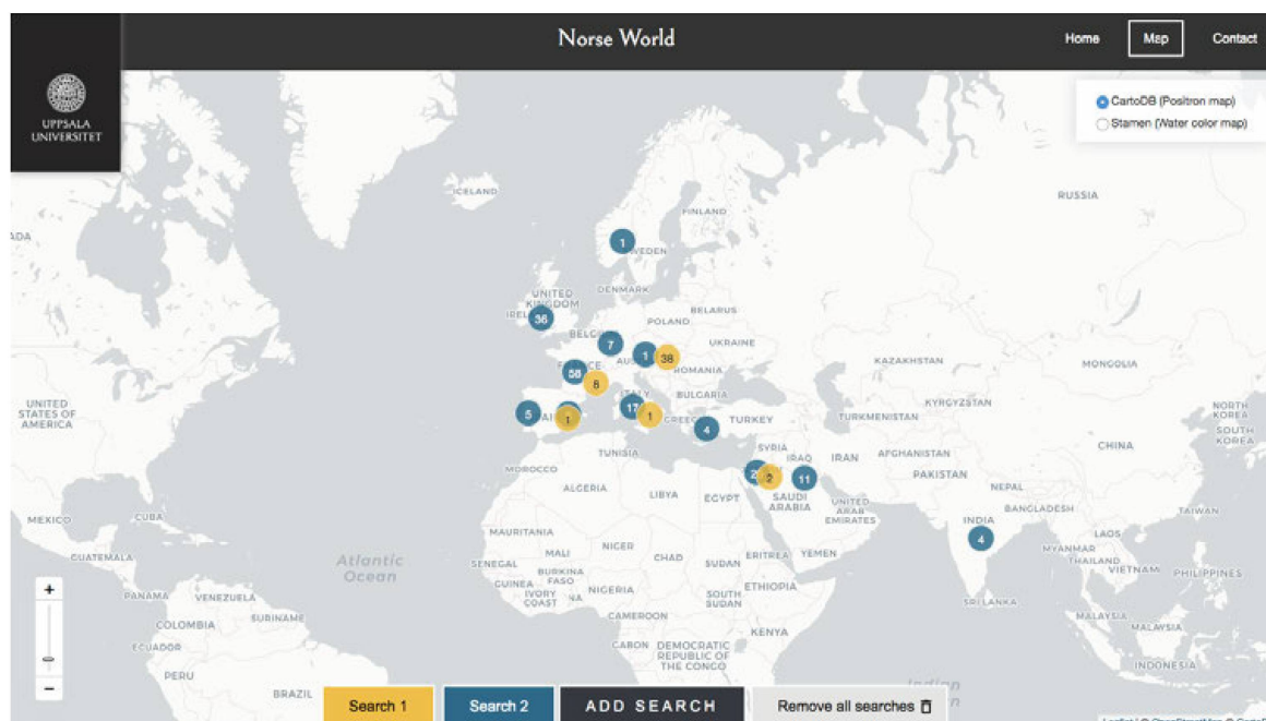
Fig. 2: Et udsnit af Norse World's brugergrænseflade, der viser belæg fra Codex Holmiensis K 47 (Stockholm, Kungliga biblioteket). De blå prikker er fra Eufemiaviserne , de gule fra håndskriftets øvrige tekster.

På nuværende tidspunkt (23. juni 2021) rummer databasen mere end 6.500 belæg fordelt på 984 steder uddraget af 94 værker fra 41 håndskrifter, 5 tidlige tryk og 3 middelalderlige runeindskrifter.