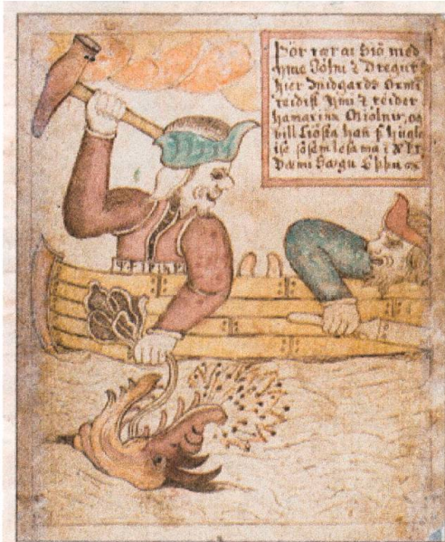
Þvíttur og Þvítturinn (Ljósm., 1898) af Jóhanna Ólafsdóttir. Myndirnar þrjár eru úr Melsteðs Eddu sem hanga uppi í Fossgerði, veiðihúsinu við Selá. (Ljósm.: Jóhanna Ólafsdóttir) Þvíttur og Þvítturinn (Ljósm., 1898) af Jóhanna Ólafsdóttir. Myndirnar þrjár eru úr Melsteðs Eddu sem hanga uppi í Fossgerði, veiðihúsinu við Selá. (Ljósm.: Jóhanna Ólafsdóttir)