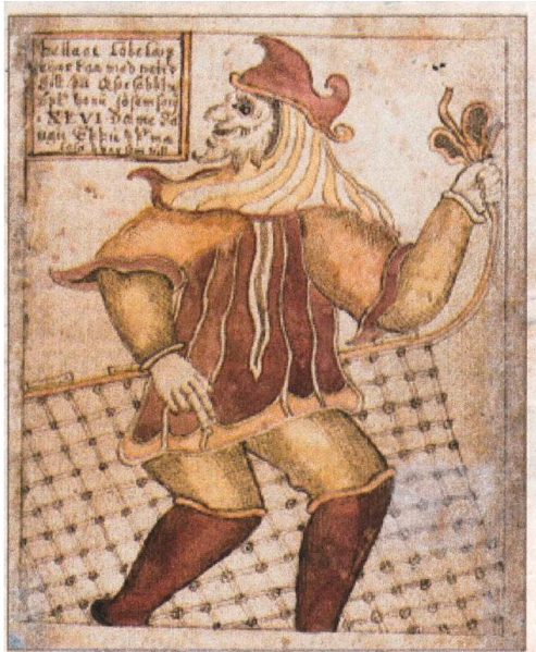
Lothianerinn með velli (Ljósm., 1898) af Jóhanna Ólafsdóttir. Myndirnar þrjár eru úr Melsteðs Eddu sem hanga uppi í Fossgerði, veiðihúsinu við Selá. (Ljósm.: Jóhanna Ólafsdóttir) Lothianerinn með velli (Ljósm., 1898) af Jóhanna Ólafsdóttir. Myndirnar þrjár eru úr Melsteðs Eddu sem hanga uppi í Fossgerði, veiðihúsinu við Selá. (Ljósm.: Jóhanna Ólafsdóttir)