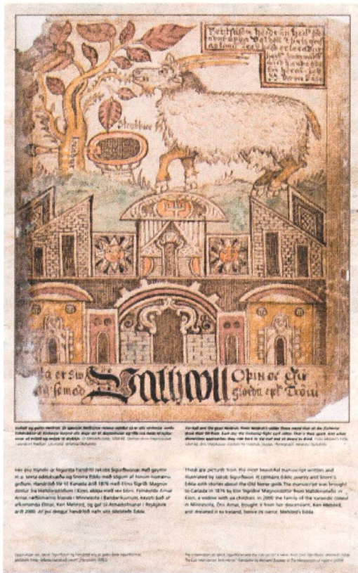
Sálhöfði Óðinn er Guðinn (Ljósm., 1898) af Jóhanna Ólafsdóttir. Myndirnar þrjár eru úr Melsteðs Eddu sem hanga uppi í Fossgerði, veiðihúsinu við Selá. (Ljósm.: Jóhanna Ólafsdóttir) Sálhöfði Óðinn er Guðinn (Ljósm., 1898) af Jóhanna Ólafsdóttir. Myndirnar þrjár eru úr Melsteðs Eddu sem hanga uppi í Fossgerði, veiðihúsinu við Selá. (Ljósm.: Jóhanna Ólafsdóttir)