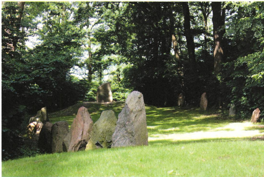
Billede 3: Glavendrupstenen og den rekonstruerede stensætning fotograferet fra en af bronzealderhøjene

Århundrede senere danner runestenen et centrum i en mindepark. 4 Det fremgår af de senere stens udtryk, at der kan lånes formelle, tekstuelle og indholdsmæssige elementer fra runestenen; stenene indgår i en dialog på tværs af tid. Eksempelvis er genforeningsstenen fra 1920 ligesom runestenen af rødtligt granit, den anvender en vertikal skriveretning, som er typisk for runesten, og indskriften danner et bånd langs fladens kant (en indramning, som dog ikke ses på Glavendrupstenen). Det fremgår tydeligt, hvem afsenderen er, nederst på stenens flade står der, at “Foreningen Glavendrupstenen satte mindesmærket”. Heller ikke denne stens funktion er begrænset til ønsket om at fastholde en udvalgt begivenhed, den er også orienteret mod erindringskulturen selv.