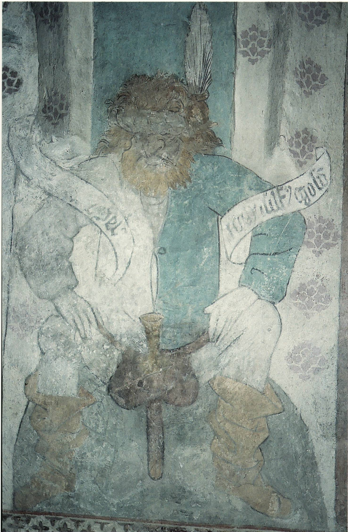
Abb. 1: Markolf