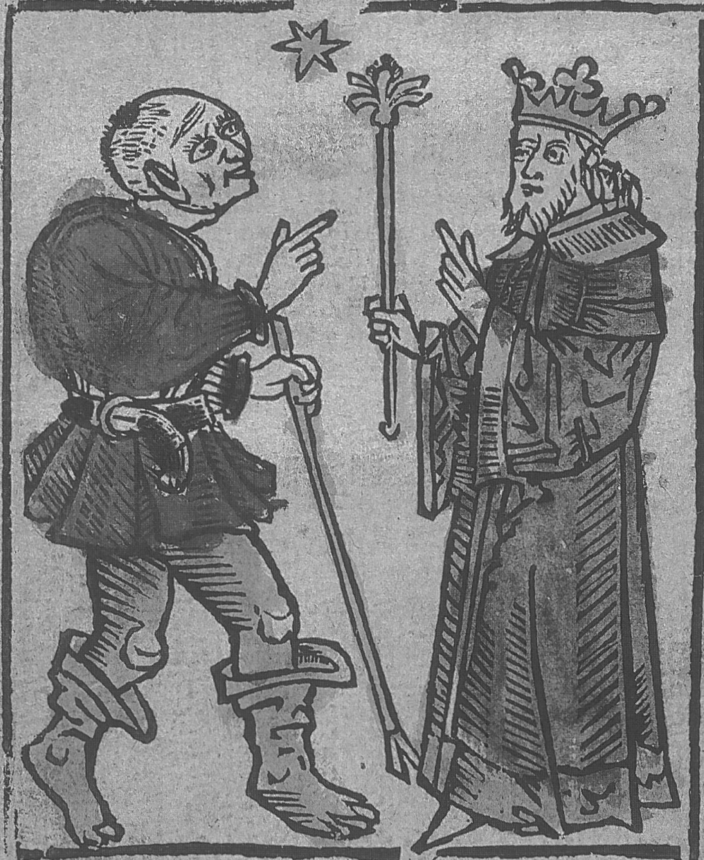
Abb. 6: Titelblatt der Collationes [Leipzig, K. Kachelofen, o.J.]: Markolf als kahler stultus vor König Salomon.

Incipiunt collatiōes quas dicuntur fecisse mutuo Rex salomon sapientissimus et: Marcolphus facie deformis et turpissimus tamen ut fertur eloquentissimus feliciter.