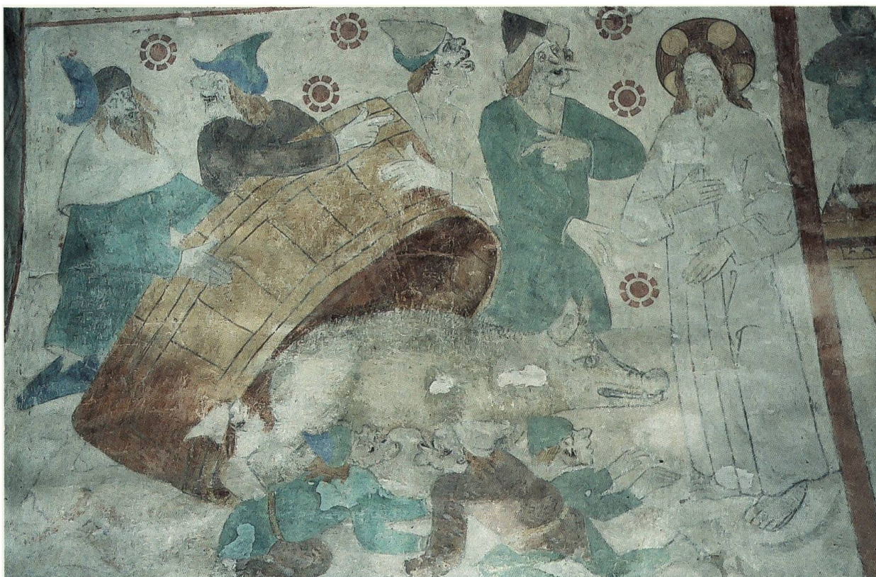
Abb. 12: Die Judensau