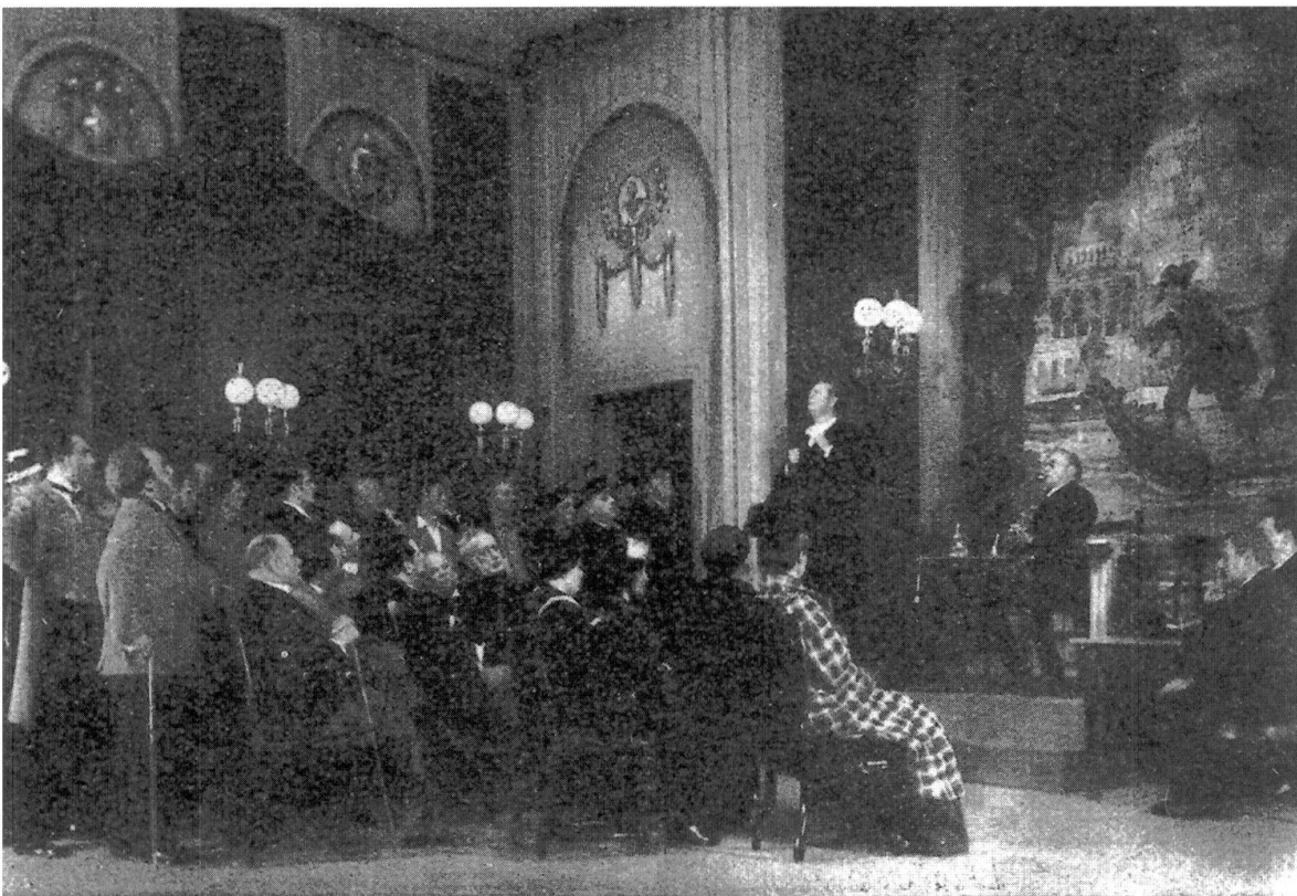
Abb. 61: Ein Volksfeind, Köln, Schauspielhaus, P: 16.12.33, R: Ernst Geis Volksversammlung (4. Akt)