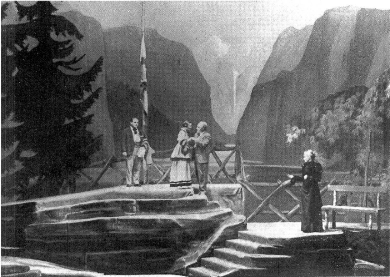
Abb. 69: Klein Eyolf, München, Prinzregententheater, P: 6.4.34, R: Friedrich Forster-Burggraf, BB: Adolf Linnebach Szenenbild