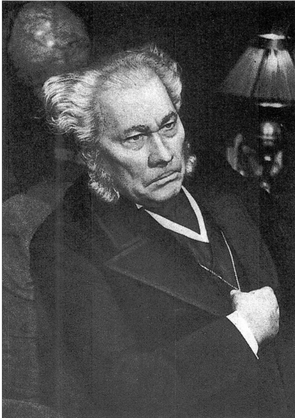
Abb. 70: John Gabriel Borkman, Berlin, Schillertheater, P: 9.3.40, R: Walter Felsenstein Paul Wegener (Borkman)