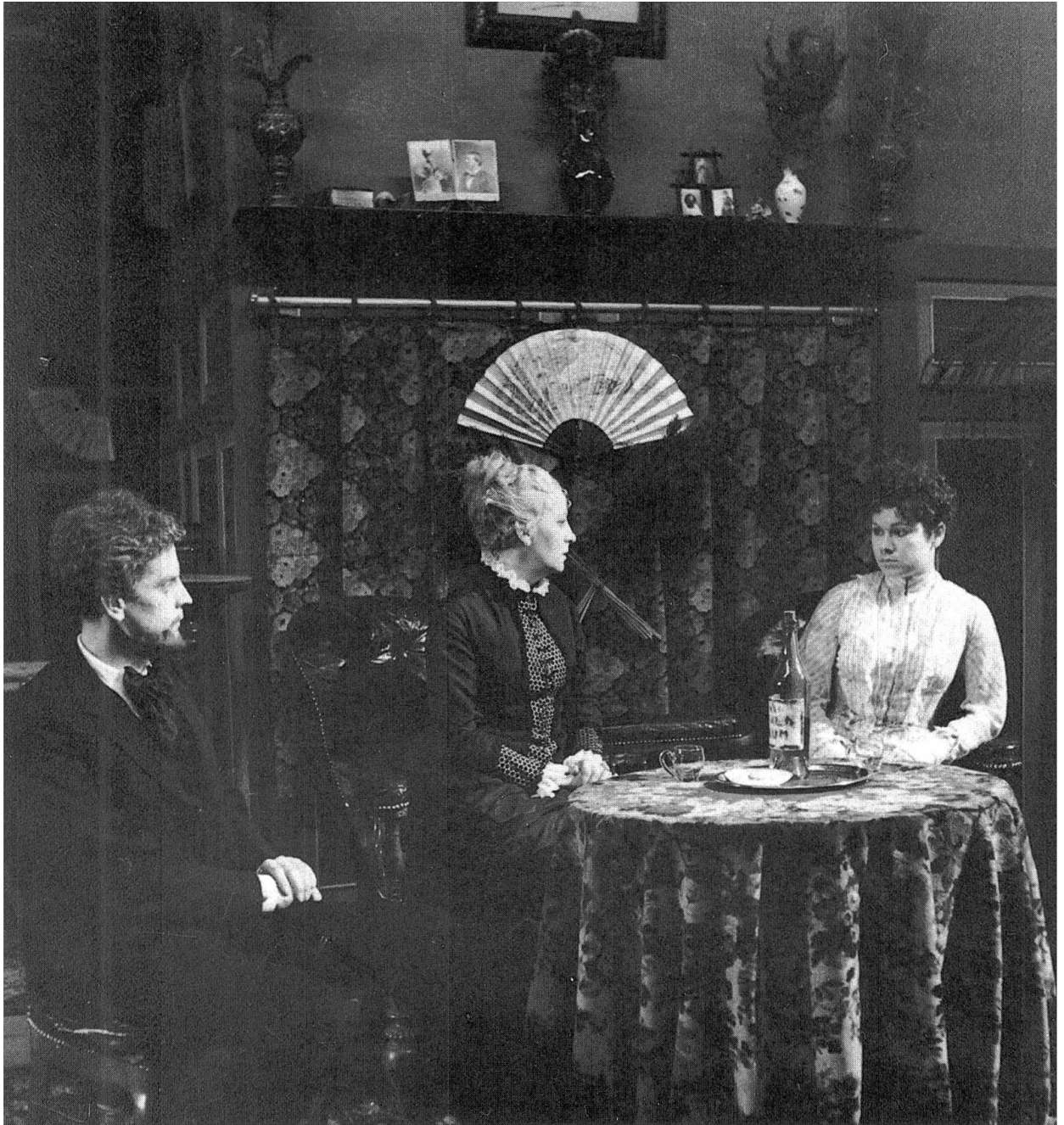
Abb. 68: Hedda Gabler, Meiningen, Landestheater, P: 10.2.38, R: Ludwig Schwartz Szenenbild