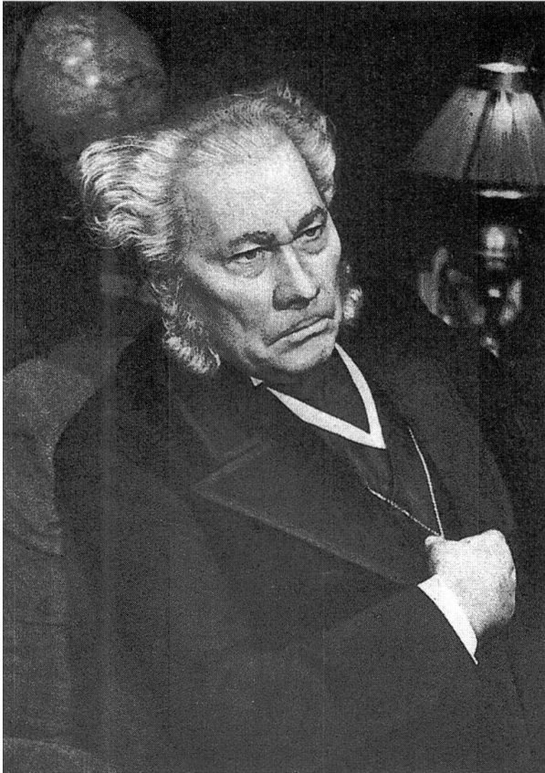
Abb. 70: John Gabriel Borkman, Berlin, Schillertheater, P: 9.3.40, R: Walter Felsenstein Paul Wegener (Borkman)