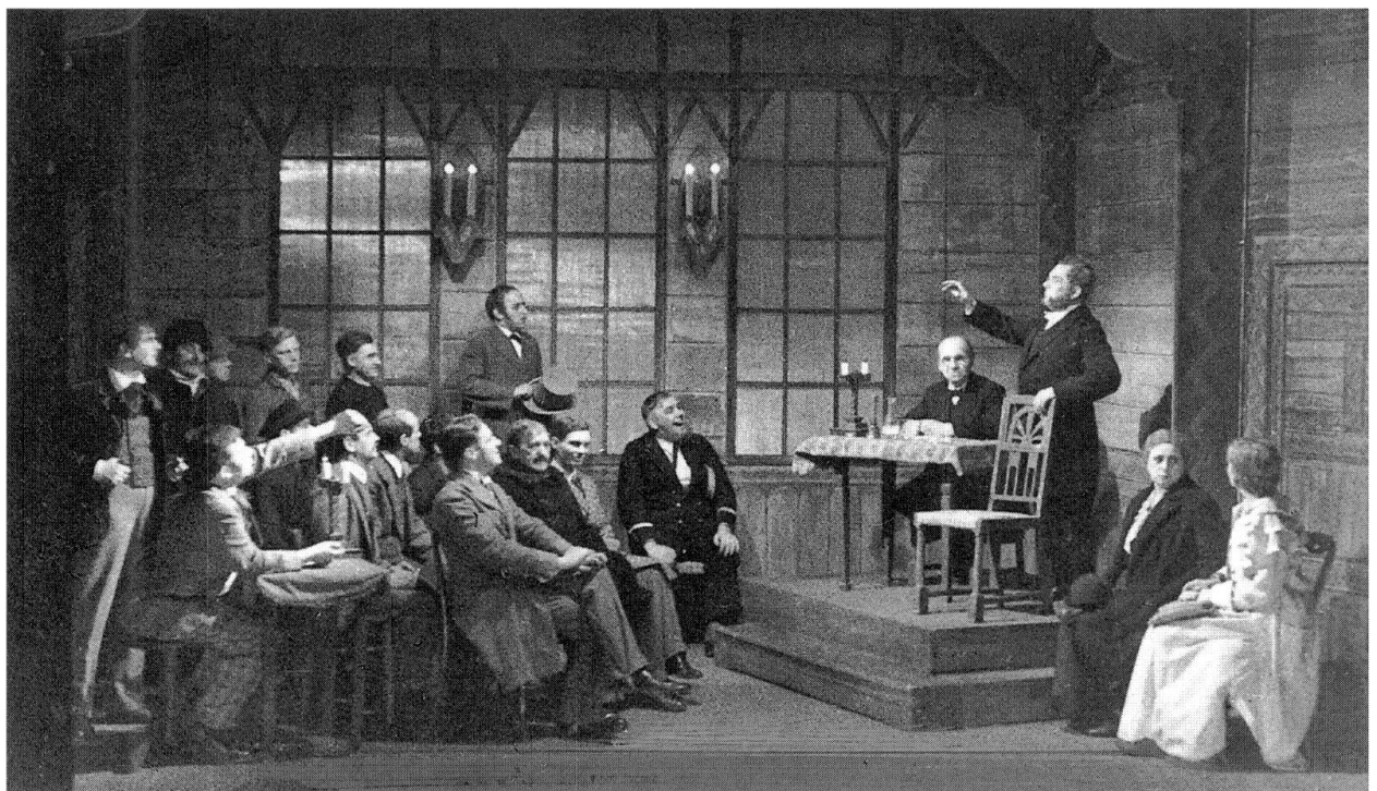
Abb. 62–63: Ein Volksfeind, Esslingen, Württembergische Landesbühne, P: 14.3.38, R: Gottfried Haaß-Berkow oben: Redaktion des „Volksboten“ (3. Akt); unten: Volksversammlung (4. Akt)