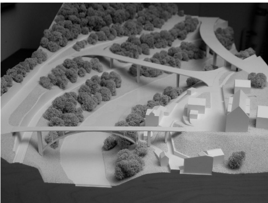
Modell einer möglichen Brückenlandschaft von Tavanasa (Conzett Bronzini Partner AG, Chur).