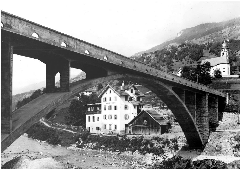
Die neu erstellte Brücke mit Blick nach Danis (Foto: W. Goetz, Chur, in: Andenken an den Bau der neuen Rheinbrücke Tavanasa-Danis, Broschüre des Baudepartements Graubünden, o. Jg.).

Besonders interessant waren die Belastungsversuche hinsichtlich des Zusammenwirkens von Bogen und Fahrbahnträger bei einseitigen Lasten. War man bei der Bemessung der grossen Steinviadukte vor dem Ersten Weltkrieg davon ausgegangen, der Bogen müsse allein sämtliche symmetrischen und asymmetrischen Lastfälle aufnehmen können, hatte Maillart in seinen versteiften Stabbogen die Verhältnisse buchstäblich auf den Kopf gestellt: In diesen Brücken wirkte der Bogen sozusagen wie eine Gelenkkette, die keine Biegemomente aufnehmen konnte. Es war Aufgabe des Versteifungsträgers, also der Fahrbahn, konzentrierte Lasten über die ganze Bogenlänge gleichmässig zu verteilen. Versell wählte einen Mittelweg zwischen diesen Extremen: Er bildete Bogen und Fahrbahn derart aus, dass sie die Biegemomente aus konzentrierten oder asymmetrischen Lasten im Verhältnis 76 % zu 24 % unter sich aufteilten. In seinen Berechnungen vernachlässigte Versell die Mitwirkung der massiven aussenliegenden Brüstungen. Dass