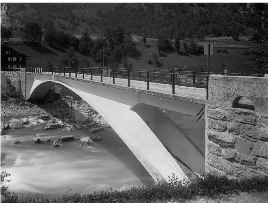
Maillarts Vorderrheinbrücke Tavanasa, die erste Dreigelenk-Hohlkastenbrücke mit ausgeschnittenen Bogenzwickeln (1905–1927) (Foto: Carl Lang/Capauliana/Fotostiftung Graubünden).

Die Brücke steht an einem geschichtsträchtigen Ort: 1905 hatte hier Robert Maillart (1872–1940) als Ingenieur und Unternehmer die erste Dreigelenk-Hohlkastenbrücke mit ausgeschnittenen Bogenzwickeln gebaut 2 und damit den Prototypen seiner berühmten Bogenbrücken wie der Salginatobelbrücke oder der Arvebrücke bei Vessy (GE) geschaffen. Während eines Unwetters am 25. September 1927 wurde Maillarts Brücke von einem Murgang des Gelgiabachs zerstört; dieser äusserst heftig und überraschend eingetretene Murgang demolierte weiter drei Häuser sowie Ställe, Bahn und Strasse; sieben Menschen kamen ums Leben. 3 Noch im Oktober organisierte Kantonsingenieur Johann Solca ein Wettbewerbsverfahren für den Neubau der Brücke und formulierte die «Leitsätze für die Ausführung der Brücke als Betonbogenbrücke» 4 . Die neue Brücke wurde flussaufwärts der Mündung des Gelgiabachs platziert, sie überquert den Vorderrhein und die Rhätische Bahn in Hochlage. Weiter wurden wesentliche konstruktive Einzelheiten bereits in den Leitsätzen festgelegt: So