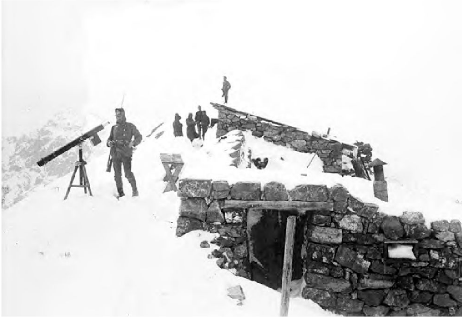
Der Schweizer Offiziersposten «Punta di Rims» während der Schweizer Grenzbesetzung – Aufnahme von Oblt. H. Escher, Bat. III, 91/92 (Staatsarchiv Graubünden, FN VIII A/83).

und dessen Hintergründe augenscheinlich (Beck 1973; ders. 1974 bzw. 1981): Der Zürcher Historiker entdeckte in den 1950er-Jahren oberhalb des Stilfserjoches mit seinen Studierenden eine in mehrere Fragmente zerbrochene Marmor-Gedenktafel ungarischer Infanteristen von 1918. Diese an den Besuch von Kaiser Karl I. im Jahr 1917 erinnernde, in deutscher und ungarischer Sprache abgefasste Memoria war möglicherweise während des Zweiten Weltkrieges von Italienern entehrt und die Trümmer dann über die südöstliche, ehemals österreichische und nunmehr italie-