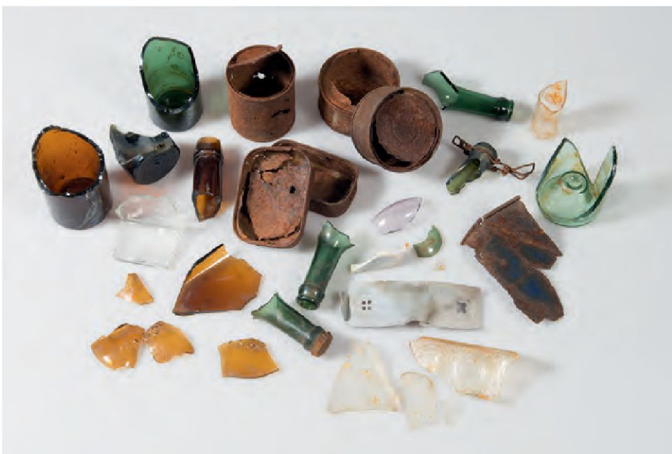
Inhalt einer Abfallgrube der Schweizer Armee nahe der Dreisprachenspitze – die Dinge als Zeichen des damaligen soldatischen Alltags.

und dessen Hintergründe augenscheinlich (Beck 1973; ders. 1974 bzw. 1981): Der Zürcher Historiker entdeckte in den 1950er-Jahren oberhalb des Stilfserjoches mit seinen Studierenden eine in mehrere Fragmente zerbrochene Marmor-Gedenktafel ungarischer Infanteristen von 1918. Diese an den Besuch von Kaiser Karl I. im Jahr 1917 erinnernde, in deutscher und ungarischer Sprache abgefasste Memoria war möglicherweise während des Zweiten Weltkrieges von Italienern entehrt und die Trümmer dann über die südöstliche, ehemals österreichische und nunmehr italie-