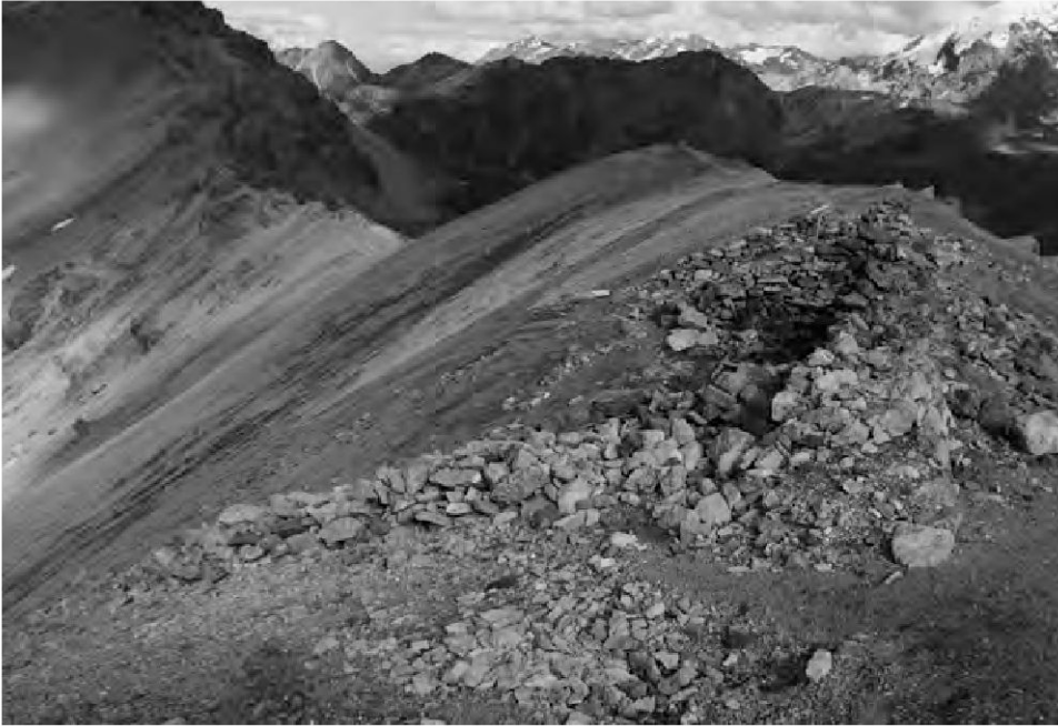
Die Reste des Schweizer Offizierspostens «Punta di Rims» auf knapp 3000m Höhe während der Dokumentation im Sommer 2014 (Foto: ADG).

2500 bis 3000 m Höhe stellte damals harte Anforderungen an die teilweise aus dem Flachland stammenden Soldaten, besonders während der Wintermonate mit Temperaturen von bis zu minus 30 °C. Tagebucheintragungen sprechen eine deutliche Sprache (Frehner/Bächtiger 1918; Gadiant o.J.; Grenzbesetzung 2009; Gustin 1990; Howald 1915; Küng 1915; Kurz 1970; Schmid 1917; Thöny 1948; Willi 1947):