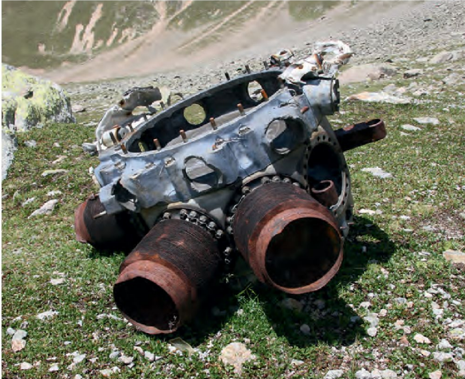
Motor des im Februar 1945 abgestürzten B-17-Bombers unterhalb des Piz Plazer, Val S-charl (Gem. Scuol) während der Dokumentation im Sommer 2013 (Foto: ADG).

Bam Bola», ein amerikanischer B-24-Bomber, wurde am 12. 7. 1944 bei einem Angriff auf München getroffen, sodass die 10-köpfige Mannschaft und der Pilot Lt. B. C. Blanton über dem Bodensee abspringen mussten. Das per Autopilot gesteuerte Flugzeug stürzte auf der Riederer-Alp oberhalb Conters ab – Teile des Wracks wurden später geborgen und wiederverwendet, der Rest in einem Moor vergraben. All diese erhaltenen Flugzeugteile, ein Motor, ein 12,7-mm-Geschütz, aber auch persönliche Objekte der damaligen Besatzung (Unterhose, Thunfischdose etc.) wurden im Herbst 2002 durch das militärische Rettungsbataillon 35 ohne archäologische Begleitung geborgen und entsorgt (Compagno 2003 sowie Held 2002). Ein weiteres Wrack aus dem Zweiten Weltkrieg ist bis heute unterhalb des Piz Plazer im Val S-charl in der Flur «il bomber» (Gem. Scuol) bekannt (Grimm 2012, 143–144).