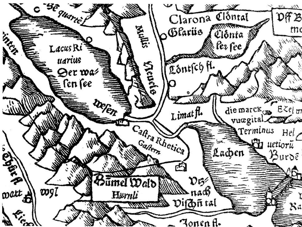
Tschudi, Schweizerkarte: Die nicht bezeichnete March ist gegenüber dem Gasterland in dem Winkel zu denken, den die Linth nach der Einmündung in die Maag mit der Limmat bildet.