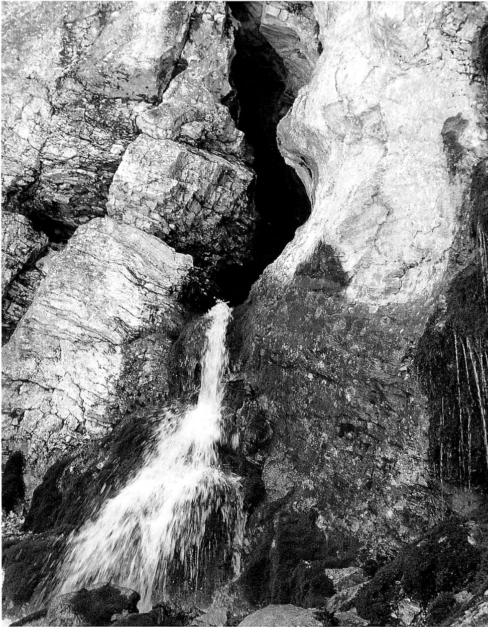
Die aus einer Felsspalte hervorsprudelnde Funtana Chistagna.

Den sich aus dem Fels ergießenden Wasserfall vor Augen kann man wirklich nur darüber staunen, wie Chiampell den Eingang zur Höhle beschrieben haben soll: «Sie hat wirklich annähernd das Aussehen eines Bogengewölbes, rund und oben bauchig.» Wohl kaum jemand sieht bei der Lektüre dieser Zeilen vor seinem geistigen Auge das, was ihn dann an Ort und Stelle erwartet, nämlich ein Schlitz im Fels, dessen Umriss der Verengung auf halber Höhe wegen noch am ehesten – in Kenntnis des arabischen Ziffernsystems – mit einer 8 oder – mit einer Metapher nach antikem Vorbild – mit einer senkrecht gestellten Pferdefessel, deren Taille nicht ganz geschlossen ist, zu vergleichen wäre. 10 Wohl bei jedem, den man vorgängig dazu angehalten hätte, die Höhle allein aufgrund der Beschreibung zu zeichnen, wäre sie mit Sicherheit um