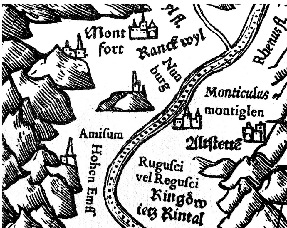
Tschudi, Schweizerkarte: Montlingen eingezeichnet im Osten statt südlich von Altstätten.

lich von Chur liegen. Und auch die rätselhafte Lage der Luziensteig im Osten von Maienfeld verdankt sich Tschudis Kartenbild. 52 Weil Tschudi den Rhein bei Maienfeld völlig realitätsfremd zunächst in westliche Richtung fließen lässt, bevor er dessen Lauf ziemlich genau nach Norden hin ausrichtet, kommt der mit dem Fläscher Berg auslaufende Bergzug und damit auch die Lu-