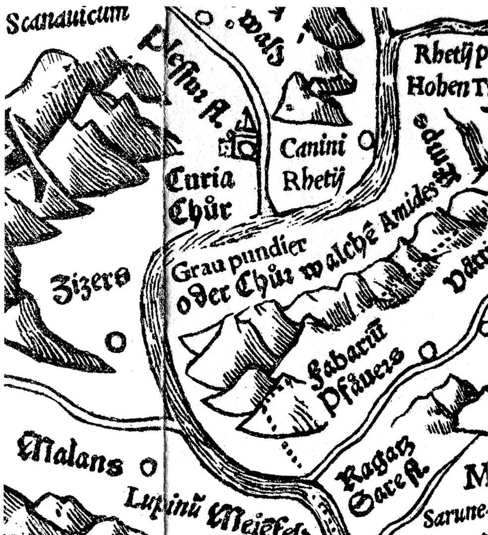
Tschudi, Schweizerkarte: Der Rhein fliesst nach Chur in Richtung Landquart zunächst in östlicher Richtung.