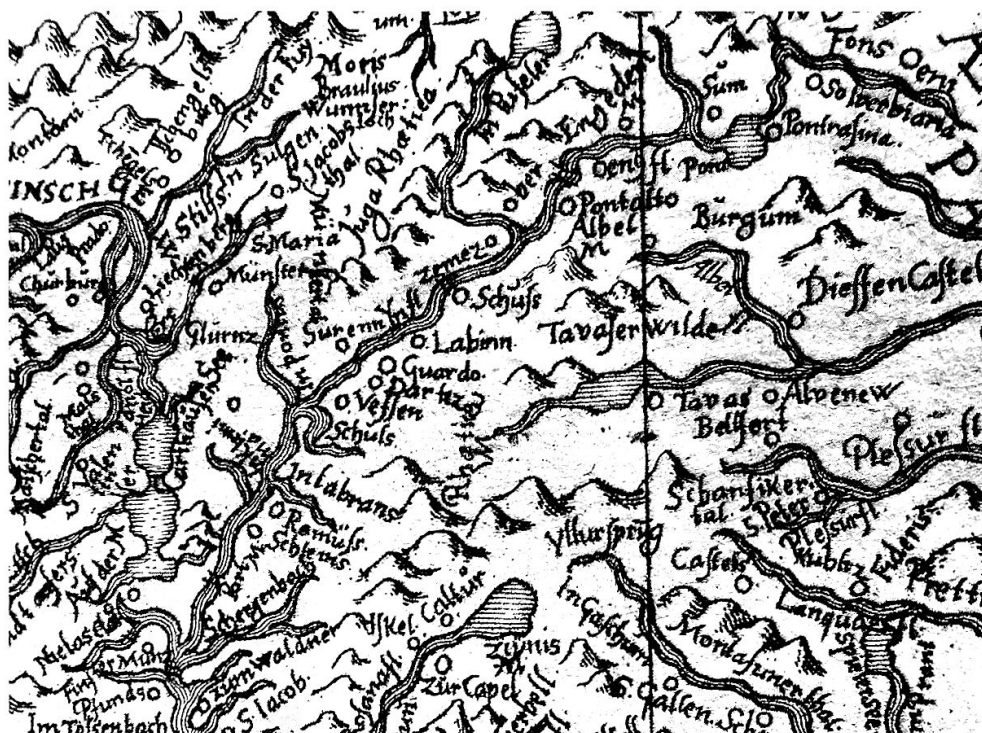
Guler, Karte Rätien: Der Verlauf des Engadins von seiner Quelle (rechts oben) bis Finstermünz (links unten).

was streng genommen nur gerade für ein paar hundert Meter bei Resgia gilt, was wir aber als generalisierende Angabe auf die ganze rechts des Inn gelegene Talflanke beziehen dürfen, denn die andere Talseite ist nach Chiampell ebenfalls als Ganzes nach Norden hin ausgerichtet. 40 Für den Leser ergäbe sich so zumindest eine ein wenig vereinfachte, aber klare Vorstellung über die Lage der Quelle: gelegen in einem von Westen her und damit parallel zu dem in östlicher Richtung fließenden Inn verlaufenden Quertal, das in ein sich von Süden her ins Engadin entwässerndes Tal mündet.