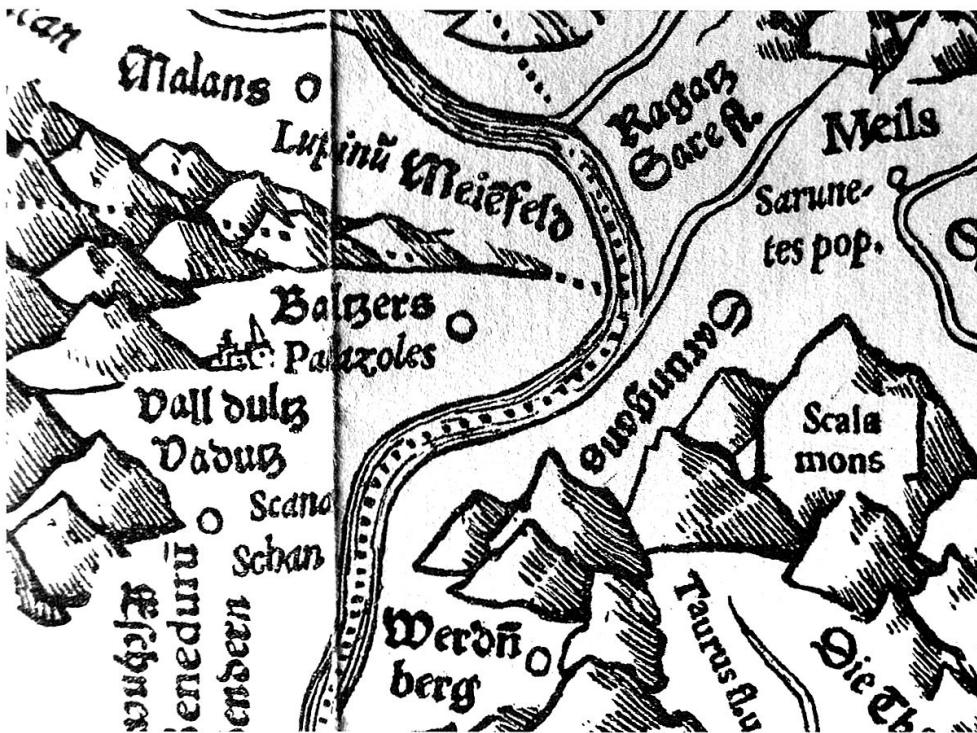
Tschudi, Schweizerkarte: Je näher am Rhein man sich Maienfeld denkt, umso östlicher liegt die Luziensteig.

lich von Chur liegen. Und auch die rätselhafte Lage der Luziensteig im Osten von Maienfeld verdankt sich Tschudis Kartenbild. 52 Weil Tschudi den Rhein bei Maienfeld völlig realitätsfremd zunächst in westliche Richtung fließen lässt, bevor er dessen Lauf ziemlich genau nach Norden hin ausrichtet, kommt der mit dem Fläscher Berg auslaufende Bergzug und damit auch die Lu-