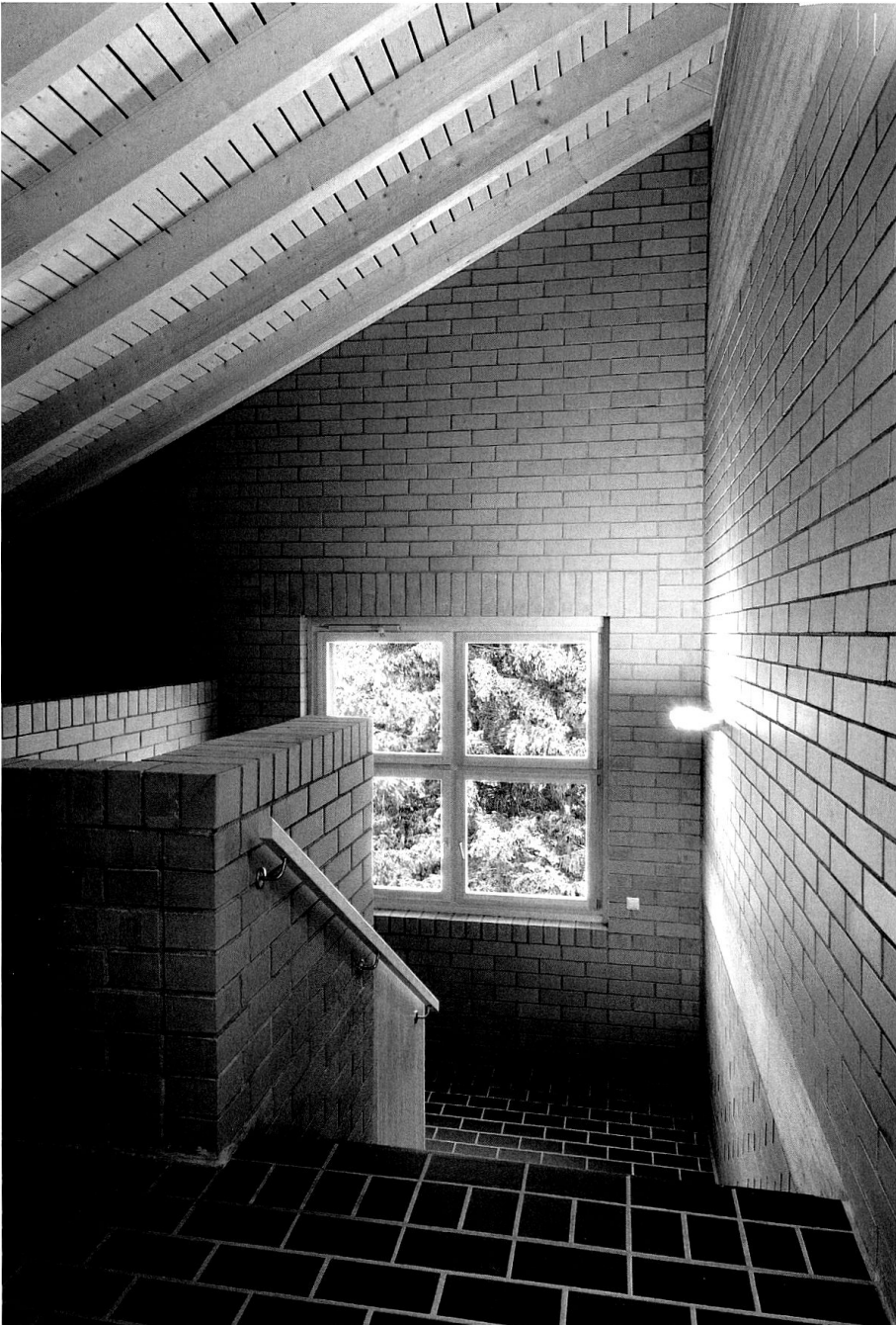
Die Sichtbacksteinwände im Eingang und im Treppenhaus sind bis unter das neue Dach weitergemauert.

aber keine Stadt- und Ortsarchitektur. Im besten Fall spricht man von collagierten Epochen und vom Stilverband, deren Kontraste, wenn überhaupt, erst durch Umbau und Patina der kommenden Zeit zum Schmelzen gebracht werden. Nehmen hingegen Architekturen aufeinander Bezug, verzichten sie zugunsten übergeordneter Stadtfigur auf eine solitäre Gestaltung. Knüpfen Stimmung und Materialisierung an das überlieferte Kolorit an, so wird eine Stadtarchitektur als Ensemble erzeugt.» Dass es da-