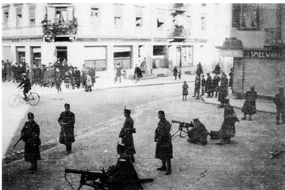
Grenchen. Mitrailleure aus dem Waadtland haben auf dem Postplatz Stellung bezogen. Nach dem durch das Oltner Aktionskomitee erklärten landesweiten Streikabbruch kam es am 14.11.1918 in Grenchen zu einer Schieserei, in der drei am Streik nicht beteiligte Arbeiter den Tod fanden.