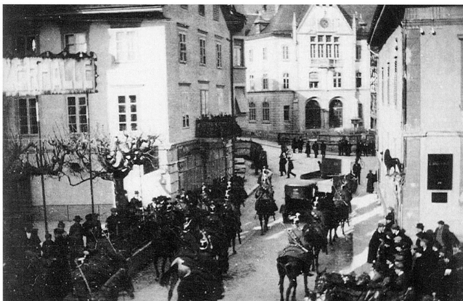
Grenchen SO. Aufmarsch von Emmentaler Dragonern vor der Post (hinten Mitte) während des Landesstreiks 1918. Während Graubünden nur am Rande vom Streik berührt wurde, sorgte im Industrieort am Jurasüdfuss eine gut organisierte Arbeiterschaft für strikte Arbeitsniederlegung. Als Folge davon wurden Armee-truppen aufgeboten.