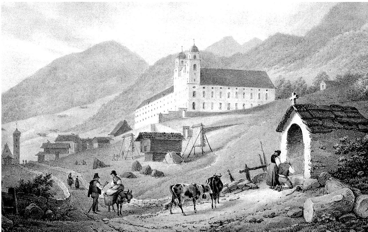
Disentis um 1827. Hauptort der Cadi. (Lithographie, Rätisches Museum)