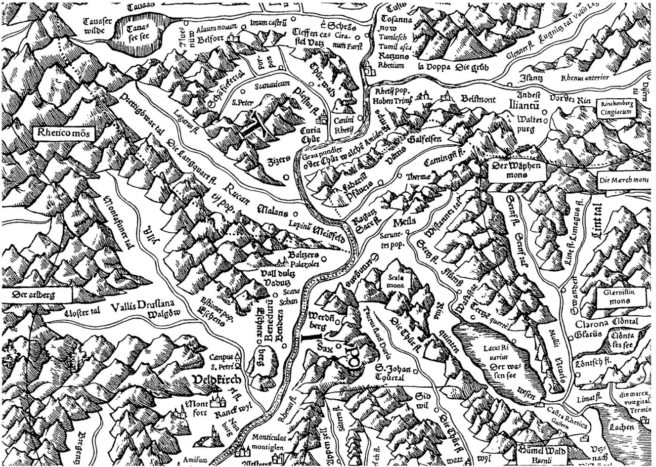
Abb. 5: Ausschnitt aus Tschudis Schweizerkarte.

hen hat, sondern auch in quantitativer. Insbesondere der Vergleich des RU mit dem von ihm ebenfalls kopierten Kollektivenverzeichnis legt jedenfalls nahe, dass der fragmentarische Charakter des Textes kaum auf Tschudi zurückzuführen ist. Lassen sich überdies noch weitere Informationen zur Gestaltung von Tschudis Vorlage gewinnen?